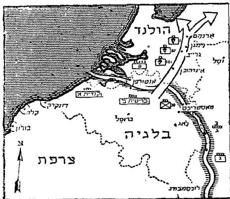
התכנית לפרצת ה"פרוודור" אל ארנהיים.

לארנהיים, ושם להתפצל לשתי זרועות: האחת תנוע מערבה, לעבר אמסטרדם אוטרקט ומשם דרומה לרוטרדם; השניה תנוע מזרחה, ובתנועת איגוף רחבה תפנה צפונה, לרוהר (תיאור המהלכים הטקטיים של מבצע זה הוא אחד התיאורים המדויקים ביותר בספר, וחלקים ממנו העתקו גם ב"מערכות"). הורוקס, אשר חש לעזרת הדיביזיות המוטסות, לא יכול היה הפעם לפתח את המהירות האופינית לו בהתקפה משולבת של שריון, רגלים ואויריה, מאחר שציר התנועה היחיד היה הכביש הצר המוביל לעבר הוויידר-זיי, ואילו עמדות הגרמנים היו מוצבות בשולי הרייכסוואלד, מקביל לכביש, ויצרו למעשה עומק הגנתי בלתי פוסק כמעט. המסע המשווין של הורוקס חילץ אמנם את שתי הדיביזיות האמריקאיות שתפסו את גשרי המאס והואאל, אך נבצר ממנו לחלץ את הדיביזיה הבריטית ה-1 שבאיזור גשר הריינוס בארנהיים, בגלל התנגדותם התקיפה של הגרמנים. בנקודה זאת מציין וילמוט, כי שגיאה טקטית רצינית נעשתה בבחירת שדות הנחיתה של הבריטים, אשר הרחקו מן הגשר — האוביקט העיקרי — וכך יצרו בעיה של הגנת מספר גדול מדי של מתחמים (הגשר וכן שדות הנחיתה). אי לואת, בסיכום הפרק, טוען וילמוט — והוא מסתמך על דעתם של מספר גנרלים גרמניים, וכן על הדוחים האנגליים — כי תכנית זאת סופה היה להצליח לו הובטחו למונטגומרי כל האמצעים העשויים להביאו לידי מצב עדיפות על פני כוחות הבריית האחרים. כונתו היא, כי איזנהאור-אר חייב היה להגביל את פאטון, אשר החל נוגש את קו זיגפריד בסביבות מק, ולהעביר את האספקה למונטגומרי.