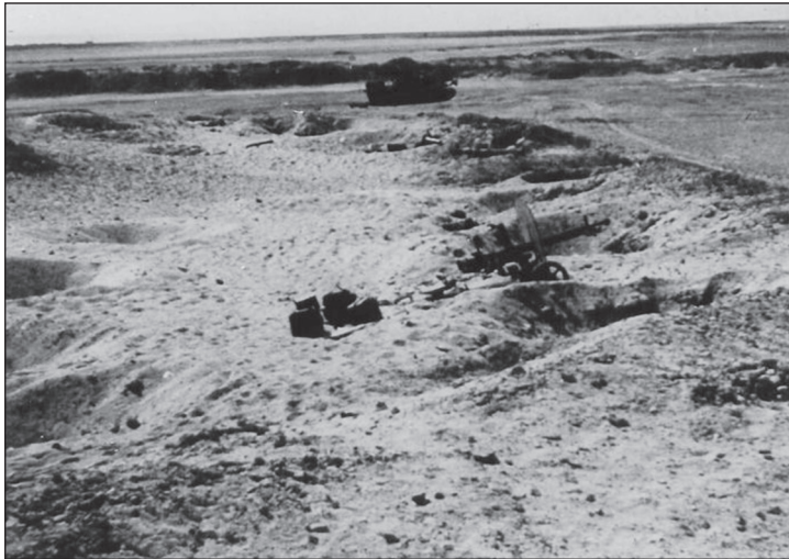
עמדות גדוד 16 המצרי מצפון לטרטור 42

מוקדם יותר נכנס גונן לרשת החטיבתית של יאירי ושאל: "האם אתם תקועים? האם יש מגע עם האויב - איפה הם? האם אתה מחזיק בציר ויכול לאבטח את עכביש?" 93 הוא רצה לתגבר את הצנחנים בכוחות חי"ר נוספים ולהקצות טנקים לאבטחתם. יש לחלץ את הפצועים, אמר לאלוף אדן, אך הכוח עצמו צריך להישאר במקומו כדי למנוע מהמצרים לחזור לעכביש. חטיבה 35 הוכנסה כדי שציר עכביש יהיה פתוח וכעת, לאחר שהוקם גשר הדוברות, גברה הנחיצות בכך. אם הצנחנים אינם יכולים להרחיב עוד יותר את השטח שבשליטתם, שלא יעשו זאת, אך יישארו וישמרו על הציר. 94