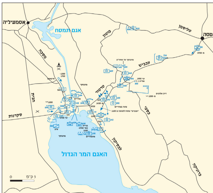
מערכת הצליחה 17 אוקטובר - מסלול ההתקדמות