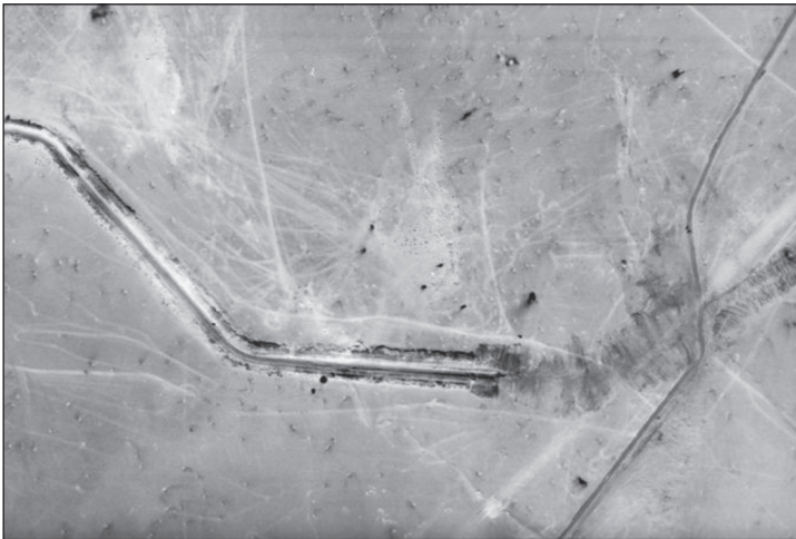
מפגש תעלת ההשקיה עם ציר טרטור, 17 באוקטובר 0830 (בחלק השמאלי העליון אפשר לראות את חיילי פלוגה ד בתוך התעלה)

יאירי לחץ על אדן שיתיר לו לפנות את כוחו מהמקום, אך גונן התמיד בהתנגדותו. 95 ב-0954 ביקש יאירי לדבר עם קצין האג"ם של אוגדה 162 כדי לקבל אישור להוצאת הצנחנים. כעבור עשרים דקות מסר אהוד ברק לעוזי יאירי: "מבקשים שתתפנה מהתעלה לכיוון עכביש 52" הכוונה היתה שחפ"ק המח"ט ינוע לקצה הדרומי של התעלה בה נמצא מאז תחילת הקרב, לא ליציאת כל הכוח, וכך אכן היה. 96 בערך בשעה 1030 הגיע שר הביטחון, משה דיין, לחפ"ק האוגדה ואחריו רב-אלוף בר-לב. אדן שיתף את בר לב בבעיה, ובר-לב אישר לבסוף את הוצאתם של הצנחנים. 97