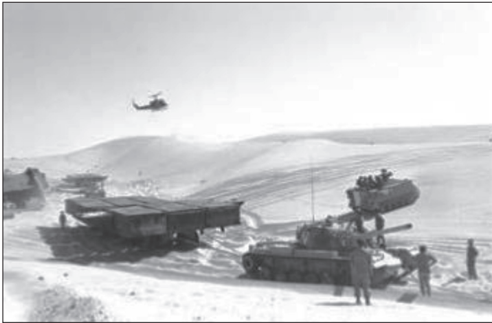
הדוברות בדרכן לתעלה

של הצנחנים שטח המואר כולו באור אינפרא-אדום על ידי המצרים ודיווחו על כך ליאירי.