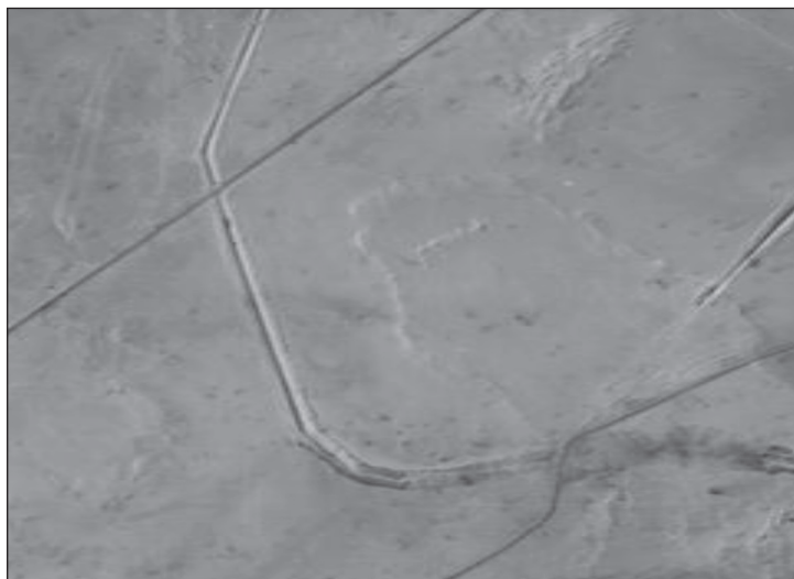
התעלה בין ציר טרטוד (מימין) וציר עכביש (משמאל) 17 באוקטובר, 0830