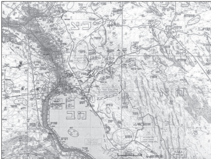
הפעילות בזירת הצליחה בליל 16-17 באוקטובר

אחר הצהריים, או ההתעלמות מההנחיה לצרף לפעולה של חטיבה 35 טנקים). מדהים יותר מכול הוא הפער העצום בין חשיבות המשימה שהוטלה ב-16 באוקטובר על חטיבה 35 (למעשה, על גדוד 890) בעיני המטכ"ל ומפקדת החזית ובין אזלת היד של האוגדה בכל הכרוך בנוהל קרב באוגדה ובהכנסת החטיבה והגדוד לקרב. חיילי הגדוד הסדירים, שלרובם היתה זו טבילת האש הראשונה, לא היו מודעים לכל שהתחולל "למעלה", במפקדות הממונות. בשבילם, המג"ד היה "הדרג העליון לפני אלוהים". החוויה הקשה שלהם לא נגזרה מן המערכה אלא מהקרב. הם חוו וזכרו בעיקר את התופת שעברו וחלקם מתקשים להשתחרר מהזיכרונות ומהסיוטים והם חווים וזוכרים אותה עד היום. החיילים לא כבשו יעדים וחלקם לא ראה בעיניו כוח מצרי, משום שהם נפגעו עוד לפני עלות השחר.