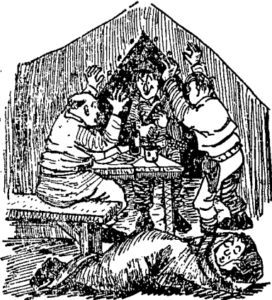
„להקנות למפקדות המתורגלות את תחושת המציאותיות“

תוך כדי ביצוע שלב הלחימה של תרגילי-קשר, תצטרך הבקרה הנמוכה לבצע דילוגים, אשר מספרם מותנה באורך