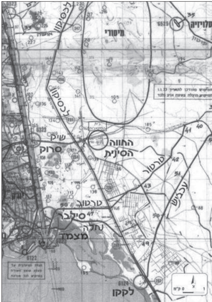
אזור הצליחה והחווה הסינית