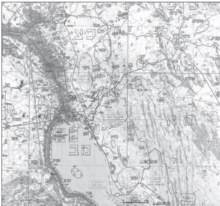
מערכת הצליחה - פעילות בליל 16-17 באוקטובר