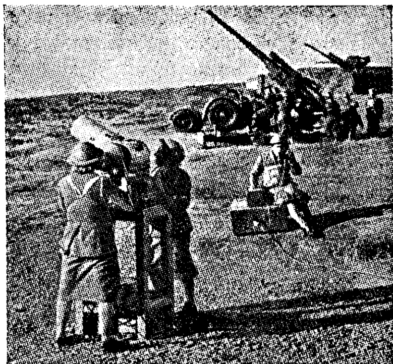
נערות "א.ט.ס." בוחנות, בעזרת קינה-תיאודוליט, את דיוק היריות, ב"הסריטן" את נפצי-הפגזים

בעית כוח האדם החלה להציק לבריטים כבר בראשית מלחמת העולם — ומאז סוף 1940 החלו הנסיונות בענין שיתוף גברים ונשים