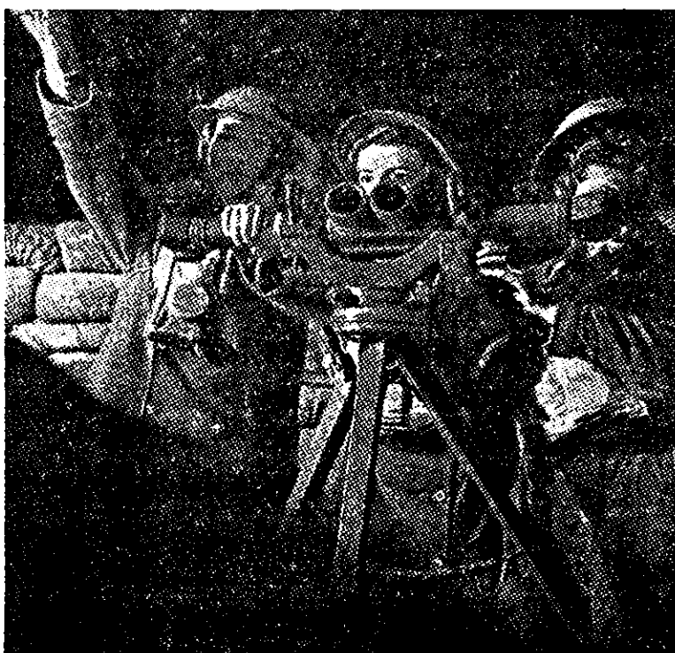
חיילות וחיילים בולשים בעזרת "מאתר", מעמדת-תותחנים, אחרי מטוסי-אויב — בזמן המערכה-על-בריטניה