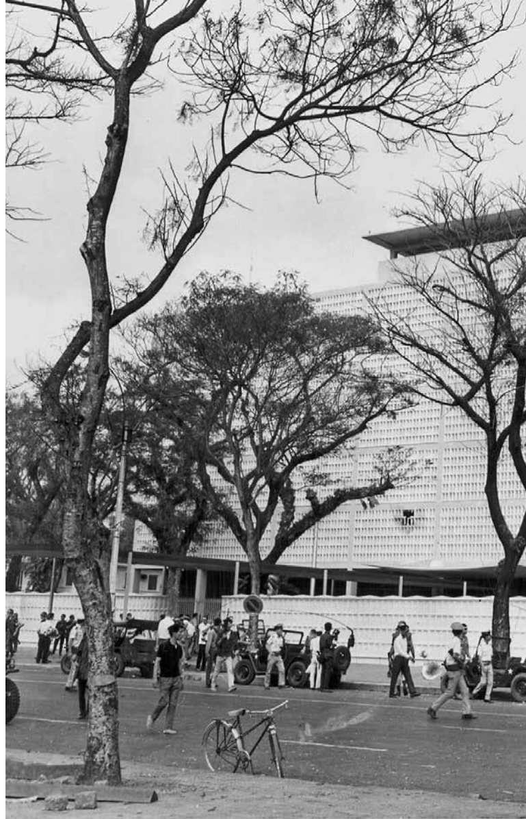
השנירות. עצם העובדה ששטח אמריקני נכבש על-ידי כוח אויב הייתה לזעזוע בתקשורת

הוויכוח שניטש בין זרועותיה השונות של קהילת המודיעין האמריקנית ערב מתקפת טט הוא נושא מרתק ביותר. כמו בהפתעות אסטרטגיות אחרות, ניתן להגיד בפה מלא כי הכתובת הייתה על הקיר. החל בספטמבר 1967 היה ברור לגנרל וסטמורלנד ולמטה MACV, כי מתוכננת מתקפה רחבת היקף של הכוחות הקומוניסטיים, וכל שנשאר היה להצביע על המועד המשוער שלה. בראשית 1968 חלחלה ההבנה עד לאחרון הלוחמים בשטח. גורמים רבים בצבא דרום וייטנאם התריעו על מהלך גדול שמתוכנן מתחת לפני השטח, ונתיב הו צ'י מין רחש באלפי כלי רכב ואנשים. הבדלי תפיסות מבצעיות, ומאבקי אגו בין גנרלים ומנהלים בכירים, הביאו לכך שהמתקפה בסופו של דבר הייתה הפתעה גמורה. ההערות למאמר הזה מתפרסמות בסוף הגיליון.