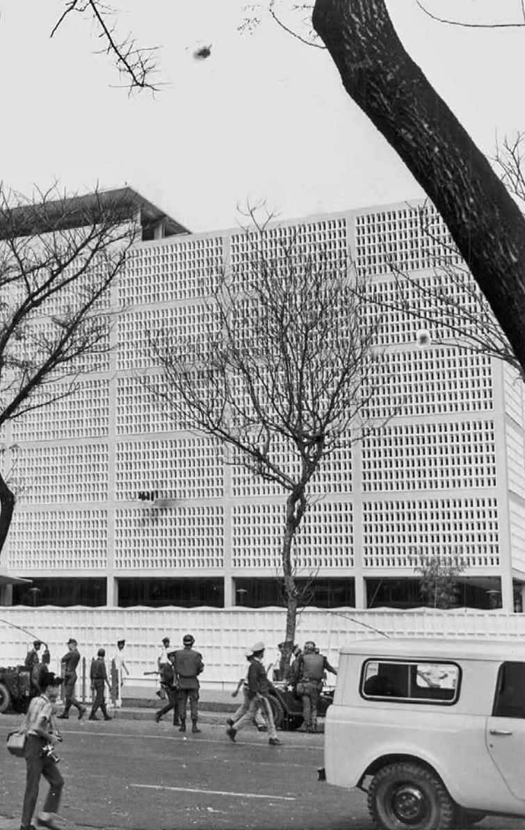
שגרירות ארצות הברית בסייגון, ינואר 1968. למרות שהכוחות השתלטו חזרה על

ממרכזי הערים הגדולות: סייגון, הואה ודה נאנג. את היחידות הסדירות של צבא הצפון ייעדו ללחימה בחלקה הצפוני של דרום וייטנאם – בעיקר בהואה ודה נאנג, בנוסף למצור בקה סאן והשליטה בכביש 9 29 ליעול הפיקוד על זירות אלה הועברו ממטה צבא צפון וייטנאם שני גנרלים בכירים לשטח הדרום, כדי לפקד מקרוב על הלחימה. על היחידות הסדירות של צבא הצפון הוטלה גם משימה נוספת – מניעת מתקפת נגד של צבא ארצות-הברית לעבר שטחה של צפון וייטנאם צפונית לקו הגבול, ה־DMZ. יחידות הווייטקונג יועדו להילחם בסייגון ובערי הבירה של הפרובינציות.