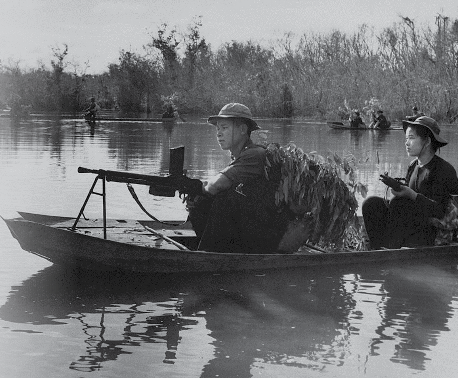
לוחמי וייטקונג. גנרל אמריקני כינה את מתקפת טט "פרל הארבור של דרום וייטנאם"

המועצות, הן דוגמאות בולטות לכך. גם צה"ל טעם את נחת זרועה של הפתעה כזו במלחמת יום הכיפורים מידי צבאות סוריה ומצרים. בכל המקרים האלה נוצרה ההפתעה האסטרטגית כתוצאה מהערכת מודיעין שגויה או חסרה. הדבר המשותף הנוסף למקרים אלה הוא שמשני צדי המתרס ניצבו מדינות בעלות צבאות סדירים עם ארגוני ביון וסוכנויות מודיעין גדולים, ובעלי אחיזה איתנה ב"צד השני של הגבעה". לכן ההפתעה שנכונה להם הייתה גם מכה כפולה, שכן מלבד התוצאות הקשות בשדה הקרב, חקירת התהליכים שהביאו לאותה הפתעה מודיעינית גילתה מחדלים קשים בהערכת כוחו של האויב וכוונותיו. המקרה בו ידון מאמר זה הוא הפרק האמריקני במלחמת וייטנאם. בשנות ה-60 נלחם צבא ארצות-הברית מול צבא צפון וייטנאם ומול ארגון הווייטקונג. ארגון הווייטקונג, או בשמו המלא "חזית השחרור