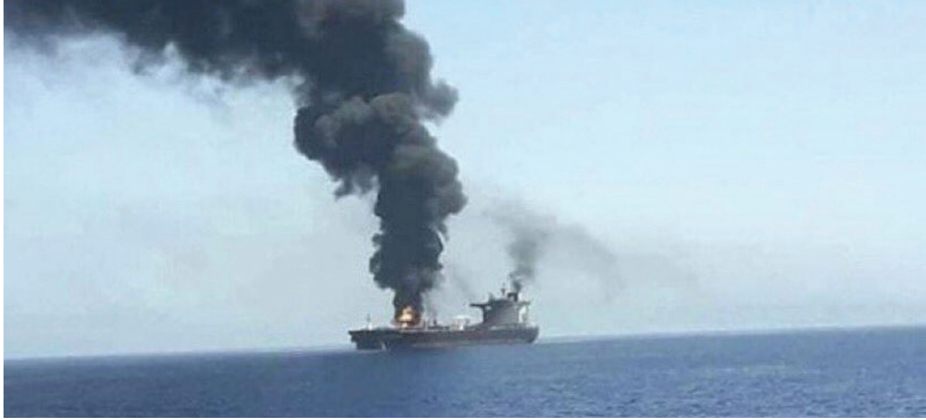
ספינה שנפגעה מכלי טיס לא מאויש איראני, באוקינוס ההודי. האיום על השינוע הימי הוא בין הגורמים היוצרים מחסור של חומרי גלם חיוניים בשרשרת הערך של הייצור הבטחוני.

המתכללת את תפיסות האגפים: מפא"ת (מנהלת הפיתוח של האמצעים והתשתיות הטכנולוגיות), אבט"ם (האגף המדיני-ביטחוני), סיב"ט (הסיוע הביטחוני הישראלי), מלמ"ב (הממונה על ביטחון מערכת הביטחון), מנה"ר (מנהל הרכש) ולצידם גופי ממשלה אחרים: משרד החוץ והמטה לביטחון לאומי. תפיסה זו צריכה לראות לנגד עיניה יעדים רחבים יותר, בדגש על מעמדה האסטרטגי הגאופוליטי והגאוכלכלי של ישראל במרחב. בשל הצורך להבטיח רציפות תפקוד מבצעית ורציפות בייצור, אנו נדרשים לשורה של צעדים וכלים שעד כה לא השתמשנו בהם או עדכנו אותם לנוכח ההתקדמות הטכנולוגית והאיומים הנוכחיים: