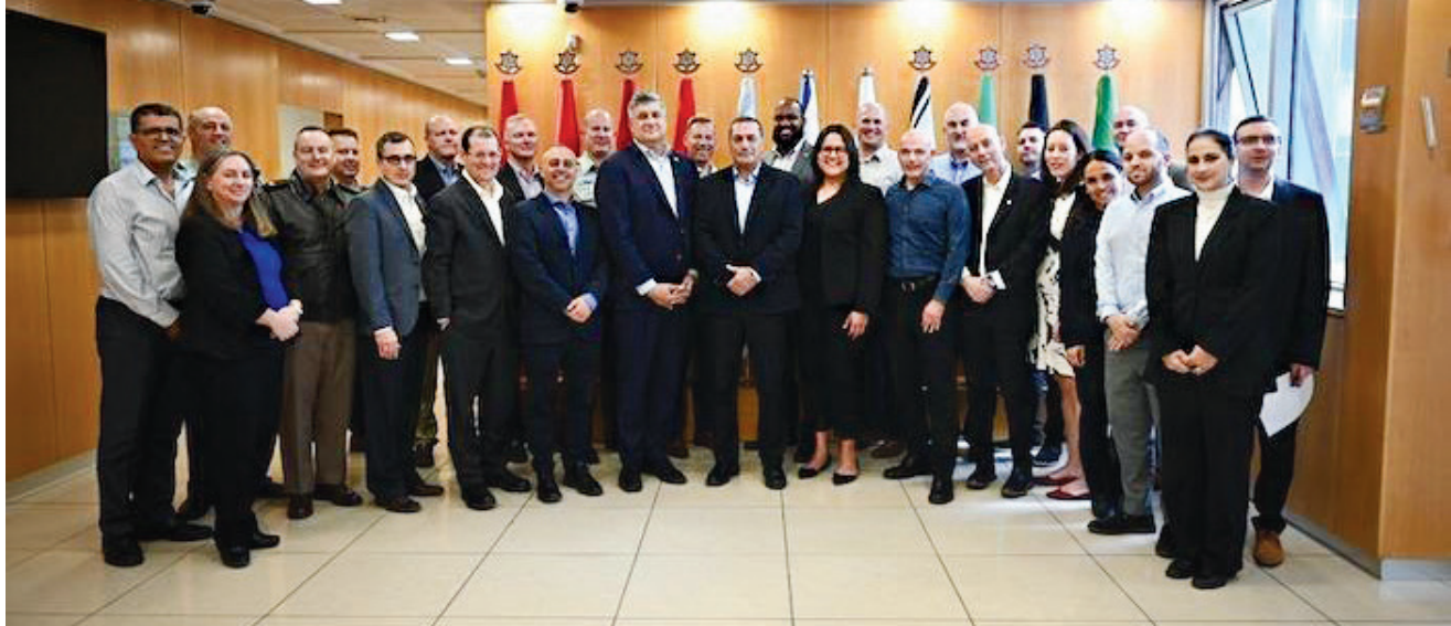
הסכם שחתמו ישראל וארצות הברית להגנה ולהבטחת האספקה בחירום, מרס 2023. מדובר בהבעת אמון ממדרגה ראשונה של משרד ההגנה האמריקני בכוחן של התעשיות הביטחוניות הישראליות.

חברות בתוך ארצות הברית שאינן חלק מתהליך הייצוא. העבודה הבין-זרועית היא אתגר אינהרנטי. מורכבות זו עלתה סביב גיבוש "תפיסות הניצחון" של הזרועות בתוך הצבא האמריקני, תחת משרד ההגנה. כל זרוע הניחה תפיסה שמסבירה איך היא מנצחת לבדה את המלחמה הבאה, אם רק האחרות לא יפריעו לה. משרד ההגנה לא סנכרן ביניהן, לא שלט במו"פ של כל זרוע או ברכש שלה. לפיכך הזרועות המשיכו לפתח ולרכוש כלים ויכולות לעצמן. 14 סוגיה נוספת, שהיא עצמה מקור לקושי של השותפות, היא הברוקרטיה האמריקנית הממשלית, מקור לא מבוטל לחלק ניכר מהעיכובים בתהליכי הרכש, הייצור והייצוא. 15