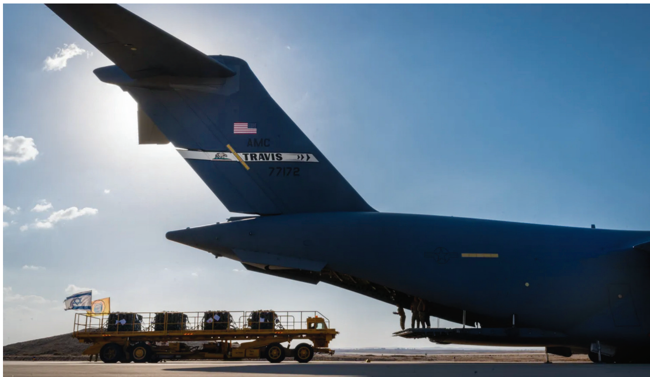
C-17 אמריקאי פורק פגזי 155 מ"מ בנבטים, במהלך "חרבות ברזל". הסכמים כגון SOSA והמדיניות הביטחונית הברורה של הממשל אפשרו במידה רבה את היכולת של צה"ל ללחום משך זמן כה רב עד כה.

ישראל על "הסכם להגנה ולהבטחת האספקה בחירום" (Security of Supply Agreement - SOSA). ההסכם יוצר מנגנונים ייחודיים הנותנים קדימות באספקת רכיבים, פלטפורמות, חימוש ושירותים לפרויקטים או למו"פ עבור חוזים קיימים של משרד ההגנה האמריקני עם תעשיות ביטחוניות במדינות השותפות, ובתנאי שמדובר בפרויקטים ביטחוניים. 31 מדובר בהבעת אמון ממדרגה ראשונה של משרד ההגנה האמריקני בכוחן של התעשיות הביטחוניות הישראליות ליתן מענה בזמן חירום לצורך מבצעי וכן אמון בעמידות של שרשראות האספקה הביטחוניות בישראל. עם זאת, ההסכם משמש "קוד התנהגות" בין המדינות והחברות למשרדי ההגנה, ומשכך אינו מחייב מבחינה משפטית.