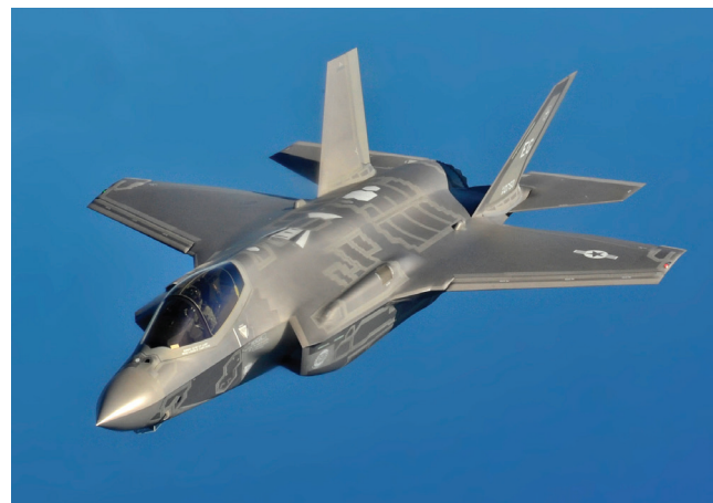
מימין: F-35A של חיל האוויר האמריקאי. משמאל: J-20 סיני. חלק מהשותפות בעולם רוכשות מארצות הברית אמל"ח מערבי, ועם זאת אינן חוששות לרכוש גם אמל"ח סיני, רוסי או אירופי ולשלבם.

התעשיות הביטחוניות, האמריקניות, האירופיות ובמידה רבה הישראליות, מצויות במתח מתמיד בין השאיפה לרווחיות ובין מגבלות הממשל המוטלות עליהן וכן בהיטלים נוספים: היותן