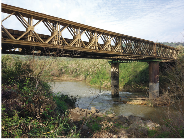
גשר אריק. המשימה הראשונה הייתה לשלוח שלושה טנקים לאבטח אותו.