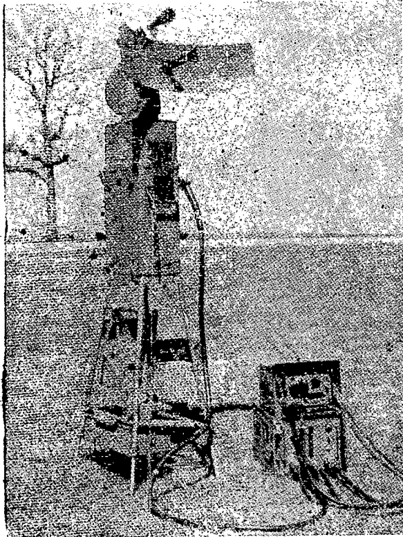
מערכת מכ"מ-השדה של „קבוצת-קרב“ אמריקאית.

החדשה); ב. רמתה של יחידת-המשנה של „קבו“ צה“ זו, דהיינו, רמה של פלוגה, לתכלית השניה נועדו המכשירים מטיפוס „הזקיף האילם“ (ראה ב„מערכות“ הוב' ק"ו); ואילו לתכלית הראי-