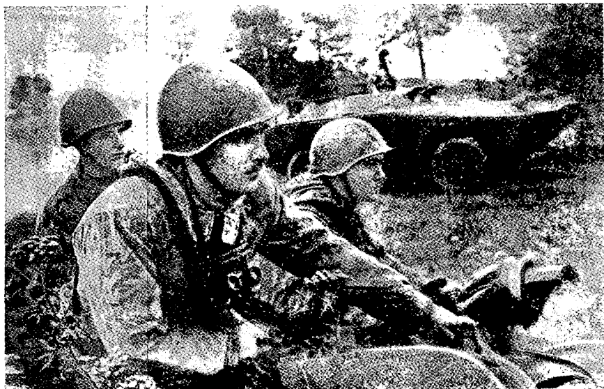
המחלקה נערכת למארב

קובע את אזורי מיקומן של כיתות-התקיפה וכיתת-החיפוי; את עמדות הצור פים והנגמ"שים ואת משימותיהם; מגדיר את סדר הפתיחה באש ואת אופן תפיסת השבויים; מוסר את האותות המוסכמים (לפתיחה באש, לתקיפת האויב ולנסיגה); וממנה את סגנון מלבד זאת, קובע מפקד המחלקה את סדר פינוי הנפגעים ואת סדר העברת השבויים, המסמכים והדגמי כלי-הנשק, וכן את הפעולות שעל המח"ל לקה לבצע אם תיתקל היא עצמה במארב רב-אויב. לאחר שדיווח למנהל התרגיל על החלטותיו ועל הטלת המשימות, מר-פייע הלה, כראש מטה הגדוד, בודק את ההחלטות ומאשר את היערכותה של המחלקה במארב.