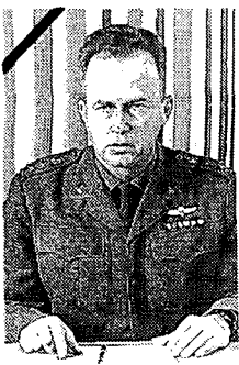
* "le bon general ordinaire" – טיפוס הגנרל אשר נפוליאון סלד ממנו ביותר...

העצמאי. אכן דרכה של הגישה העקיפה היא היא הדרך לנצח במלחמות".