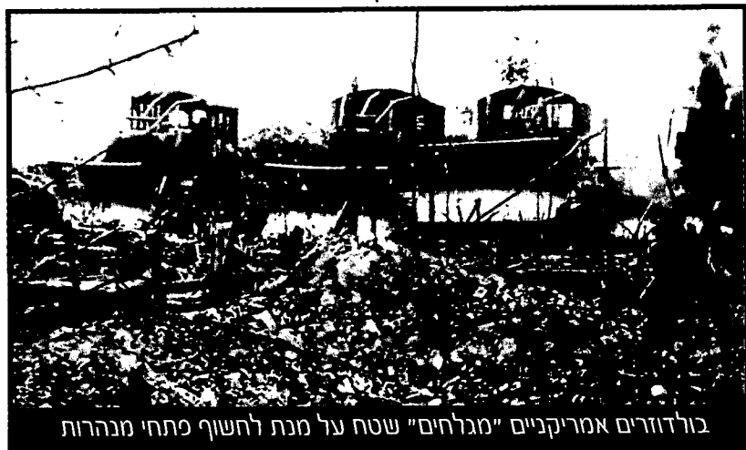
בולדוזרים אמריקניים "מגלחים" שטח על מנת לחשוף פתחי מנהרות

מערך המחילות היה מורכב ביותר ומפותל ושימש לצרכים שונים: מעבר בין מקומות שונים ללא אפשרות גילוי, אחסון אספקה, בתי-חולים, תת-קרקעיים, מפקדות ואף חדרי מנוחה. באתר http://www.soft.net.uk/entrinet/tactics6.htm ניתן לקבל מושג על המבנה של רשת המחילות, על השימושים שהיו להן ועל אמצעי ההגנה שנקטו חופריהן, ובהם מלכודות