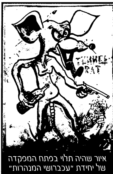
איור שהיה תלוי בכתח המפקדה של יחידת "עכברושי המנהרות"

רק לאחר שלושה ימים של חיפושים עקרים "נפל האסימון" אצל מפקד הגדוד, והוא הבין שכוחותיו פועלים