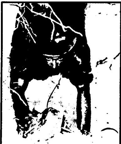
לוחם ביחידת "עכברושי המנהרות" בוחן מנהרה של הווייט-קונג

עייפים ומיוזעים ותוך שהם ממתנינים להמשך הפקודות, התיישבו החיילים למנוחה קצרה. סמל סטיוארט