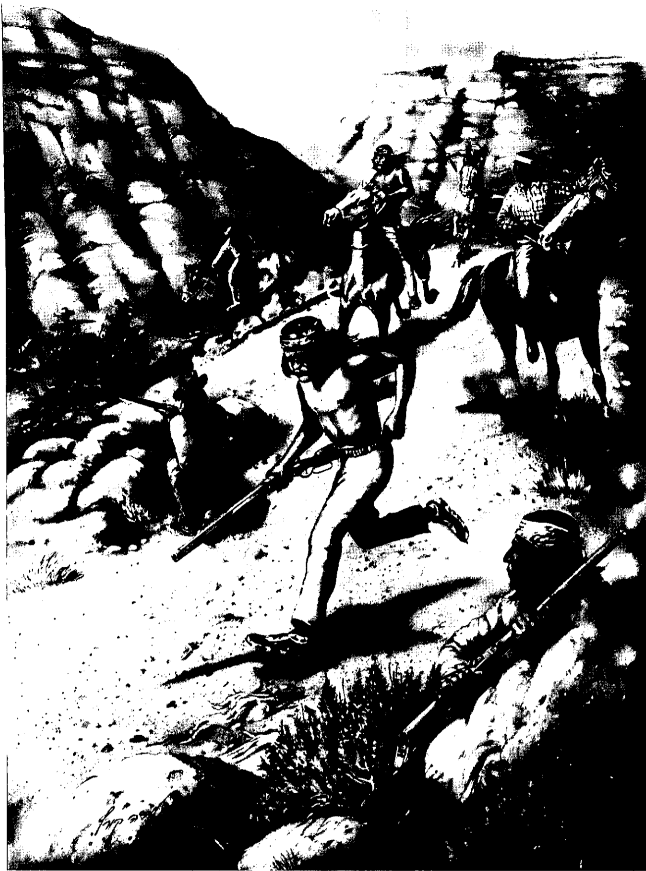
המלחמה באינדיאנים - עימות בעצימות נמוכה? (ציור: טוביה קורץ)

האירופית, יכול לנצח במהפכה. 15 עם תפיסה זו המשיך וושינגטון לנהל את המלחמה. הקרב המכריע האחרון במהפכה היה קרב סדור ששילב את כל טקטיקות הלחימה האירופיות: במצור על יורקטאון (Yorktown), וירג'יניה (1781), עמדו צבאות סדירים האחד מול השני, התקיימה לחימת מצור לפי תורתו של המהנדס הצרפתי המהולל וובאן (Vauban), והיה שיתוף פעולה בין יחידות צבאיות ביבשה ובין אוניות הצי הצרפתי. הניצחון האמריקאי ביורקטאון הוא זה שהכריע את המלחמה לטובתה של ארצות הברית. 16