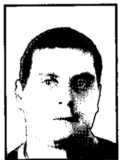
מרצה במכללה לפיקוד טקטי

מראשית דרכה של ארצות הברית כמדינה עצמאית התנהל ויכוח נוקב על אופיו ודמותו של הצבא האמריקאי. למרות רצונם של חלק מהאבות המייסדים בהקמתו של צבא קבע מקצועי, התפיסה הפוליטית, החברתית והתרבותית בארצות הברית היתה נגד צבא כזה (No Standing Army). סוגיית עיצובו ותפקידו של הצבא האמריקאי נכללת בסוגייה מרכזית ורחבה הרבה יותר, והיא הוויכוח אודות אופיה הפוליטי של ארצות הברית. סוגייה זו ממשיכה להעסיק את הציבור האמריקאי, כמו גם את מוסדותיה הפוליטיים והמשפטיים של ארצות הברית, עד עצם היום הזה.