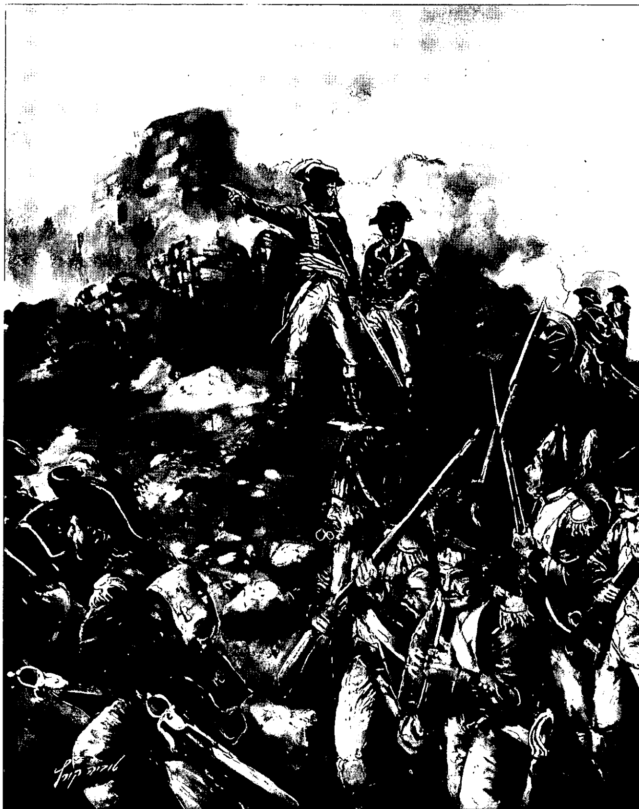
נפוליאון בקרב על עכו - שימש כמזכיר בכל האקדמיות הצבאיות במערב, ופרשניו, ובמיוחד ז'ומינו, נחשבו להוגי הדעות הצבאיים החשובים של המאה ה-19, בעידן שלפני התנועה הרומנטית ובכורתו של קלאוזביץ. (ציור: טוביה קורץ)

ג'פרסון ראה את מקומו של הצבא בתוך המערכת הכלכלית הליברלית אליה שאף, וסבר כי יכולתו ההנדסית של הצבא עשויה לעזור להתפשטות ארצות הברית מערבה להרי האפאלצ'ים, וכן להגן על המתישבים בספר האמריקאי. ב-1802 הורה ג'פרסון להפוך בית ספר ללימודי הנדסה, שהקים וושינגטון בווסט פוינט, בשנת 1794, לאקדמיה צבאית בה ילמדו בעיקר את מקצועות ההנדסה, הביצור והארטילריה. שלושה מקצועות אלה נחשבו למקצועות