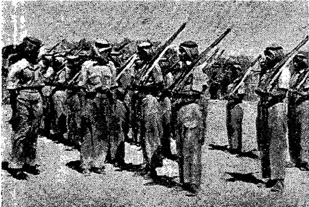
שינוי הלבוש: מבני־שבטים סתם — ל„איסטרטיות“ של חוף־האמנה שבעומן, החומר הגלמי

ישוב מועט ושימון רב. „ישוב“ שבאחד מנאות המוכר של בוריימי, סלע מחלוקת בין השייכים של „חוף האמנה“ (קר, בריטניה) לסעודיה. התמרים גדלים בחלקות מישור־מלוח אשר למר־גלות גבעות־החול הנישאות.