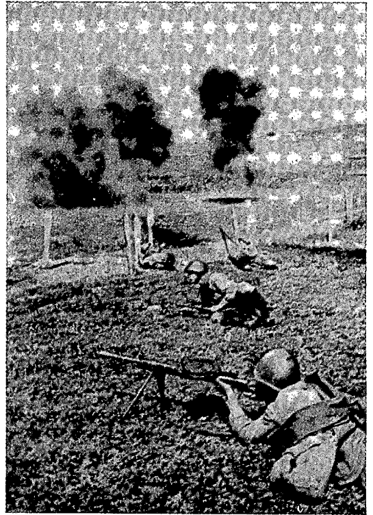
חיפוי על פריצת מכשול

אימת את עדיפות ההיערכות במספר דרגים; זו יצרה תנאים להגברה מתמדת של עצמת המהלומה במהלך הקרב, לביצוע התמרון, להדיפת התקפות־הנגד של האויב — ולפריצת מערך־ההגנה של האויב למזוא עומקו בקצב מוגבר.