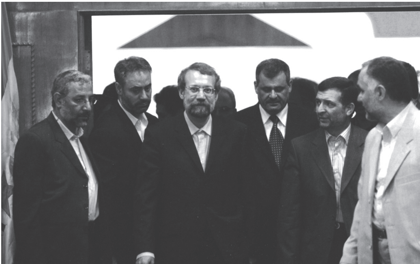
עלי לריג'ני (מזוקן, במרכז), היו"ר לשעבר של צוות המשא ומתן האיראני לענייני הגרעין | תוכנית הגרעין של איראן מילאה בתחילה צורך דפנסיבי והיא לא כוונה נגד ישראל, אלא נגד סכנות קרובות יותר: בריה"מ ועיראק