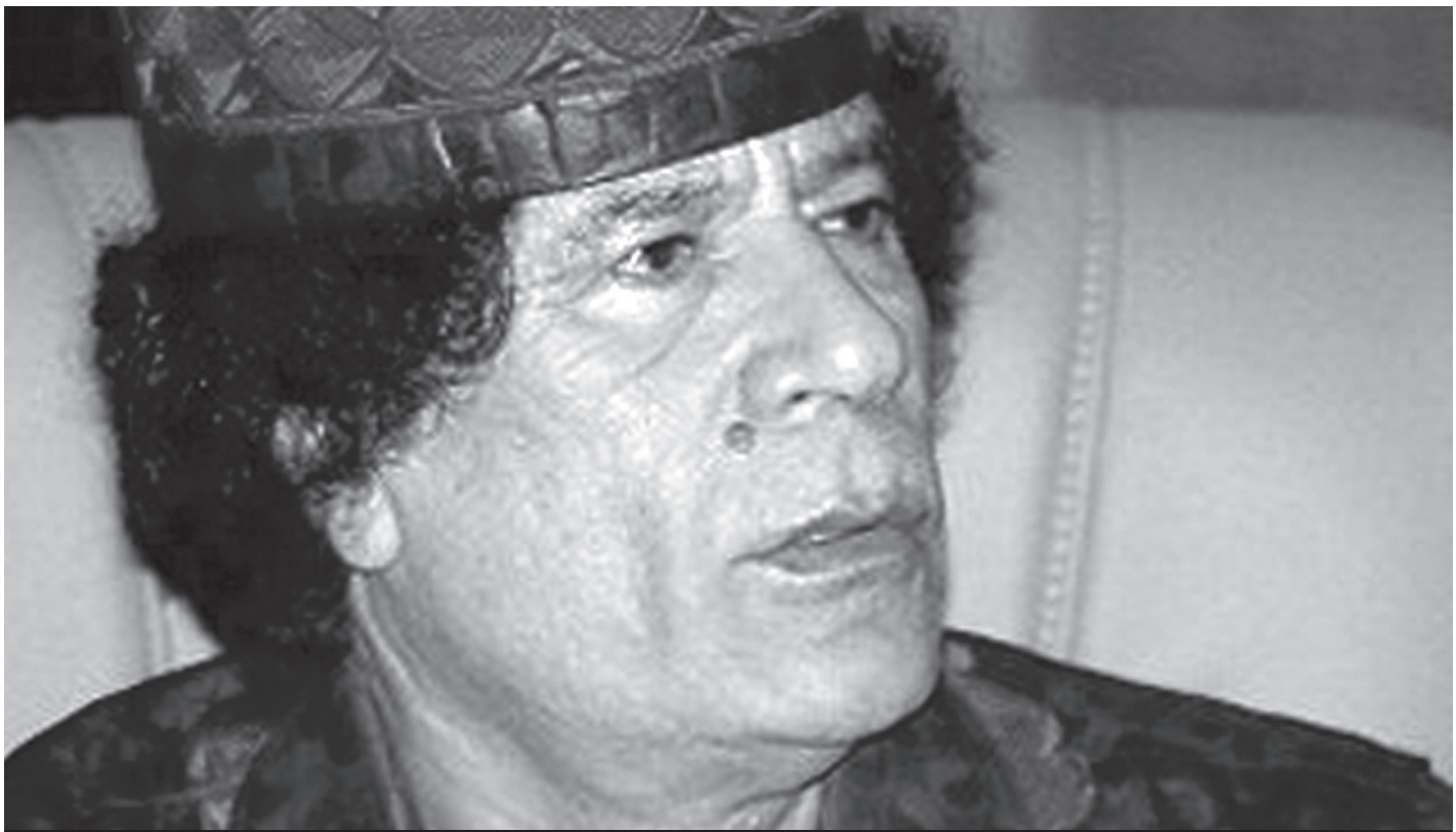
שליט לוב, מועמר קדאפי | בעשור האחרון הצליחה לוב להיחלץ מהבידוד הבין-לאומי לאחר שיצרה לעצמה תדמית חיובית יותר. לשם כך צימצם קדאפי את תמיכתה של לוב בטרור, קידם יוזמות שלום מקומיות ואזוריות ואף ריכך את יחסו לסכסוך הישראלי-פלסטיני

אף-על-פי-כן נראה כי השיקול הכלכלי לא היה הדומיננטי בהחלטה לזנוח את המאמץ להשיג נשק גרעיני וטילים ארוכי טווח. גם לא היו אלה קשיים טכנולוגיים שגרמו ללוב לוותר על המסלול הגרעיני. גם אם היא נתקלה בבעיות טכנולוגיות במהלך שנות ה-90, הרי עבד אל-קאדר חאן, אבי הפצצה הפקיסטנית, היה מוכן לבוא לעזרתה.