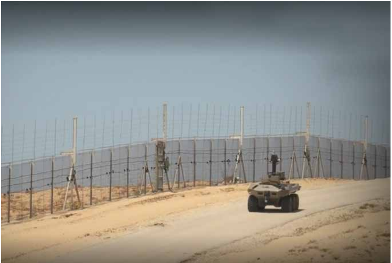
פרויקט "גבול חכם וקטלני" באוגדת עזה. הביקורת בתוך צה"ל על הקישור הצמוד בין הווה לעתיד כוחות היבשה הייתה נרחבת יחסית, מדרג המג"ד ועד דרג מפקדי הפיקוד, אך היא לא יצאה לתקשורת, למעט אמירות כלליות.

בתרגיל חטיבתי התמקדו במערכת טכנולוגית חדישה שהגיעה לצורך התרגיל. הלוחמים מוכשרים להפעלתה בהליך מזורז ולא יעיל ולבסוף היא מופעלת על-ידי אנשי החברה המסחרית ואנשי מחלקת אמל"ח הנמצאים שם. 23