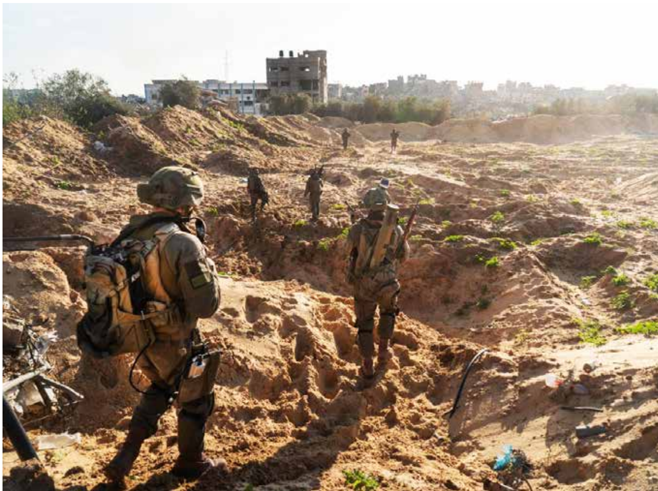
היחידה הרב-ממדית בפעילות בעזה ב"חרבות ברזל". במקור, הכוונה הייתה כי יכולות ושיטות לחימה חדשות שינסו ביחידה יוטמעו אחר כך בכל יחידות היבשה של צה"ל.

המיידיות מעבודה ויותר בצבירת הון ובקבלה מתמשכת של הערכה על יכולותיו, כישוריו, דימויו ומעמדו. 9 בארגונים שונים, ולרבות בצה"ל, כמו גם בחברה הישראלית בכללותה, העיסוק בעתיד כרוך בדמותו של היזם, של החדשן. עם זאת ייתכן שבפועל קצב החידושים בתחום הצבאי בעולם כולו הואט במאה ה-21. 10 לפיכך יש לראות את העיסוק בחדשנות וביזמות כביטוי נוסף למגמות החברתיות והתרבותיות הרחבות והמתמשכות. העידן הנאוליברלי והחיים תחת ההגמוניה של הכלכלה הפיננסית מחייבים את הפרט להמציא את עצמו ואת סביבתם מחדש כחלק מהתחרות המתמדת על משאבים, ובכלל זאת דימוי. כלומר הסובייקט הנאוליברלי נדרש להיות חדשן ויזם, בכל תחום שהוא, כחלק מהאתוס של "האדם הטוב" וכחלק מהתרבות הארגונית של כל "ארגון מצליח".