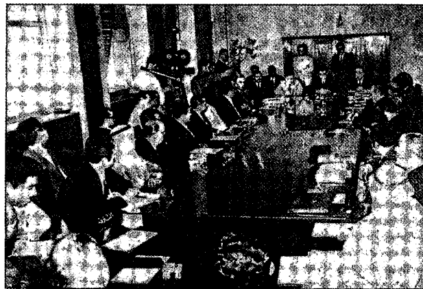
ישיבה של ועדת חרם נגד ישראל

הנטל בו נושאת ישראל כתוצאה מהלחמה הכלכלית הערבית לא יוקל אפוא משמעותית כתוצאה מהסכם השלום עם מצרים; וגורמים שאינם קשורים ישירות ביחסים שבין ישראל לבין הערבים (משבר האנרגיה, עודפי הכספים הערביים והבעיות הכלכליות במערב ובעולם המתפתח) עלולים אף להביא להחרפת לחמה זו.