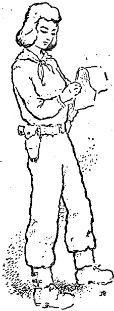
הבנות כבשו את מקומן והפכו להיות מפקדות

והרגלים את המסורת של יחסי אתונה בין הלוחמים לבין עצמם וכן בינם למפקדם. כי חיוני הוא שהמפקד הנמוך המתחיל במפקד חוליה וכתה יהיה חודר כוח התלהבות לבצוע משימות אמונים ולא ירגיש עצמו כברגים הממלאים פקודות. המטרה היא לראות את כל פיקוד היחידה כמשפחת מפקדים אשר הבעיה העיקרית שלה היא להעלות את רמת המפקד הנמוך ולעשותו שותף למשימה. אפשר לציין כי ברוב המקרים ההצלחה היתה מלאה. היחסים הטובים בין מפקדים לבין עצמם גרמו ליחסים משותפים בין מפקדים ישירים לחניכים ומאריך להעלאת רמת האמונים. צה"ל נכנס במשך הזמן למסגרת שאף כי רב בה עדיין החסר והסתום וישנם פתרונות ארעי ולבטי קשיים הרי ממוגת היא בתוכה בצורה מקורית (ביחוד ניכר הדבר ביחידות מקוריות כגון הנח"ל) את זרגת האימונים הגבוהה וההוי החברי בין מפקד לפקודיו שהיא מורשת מלחמת השחרור. עדה כהן