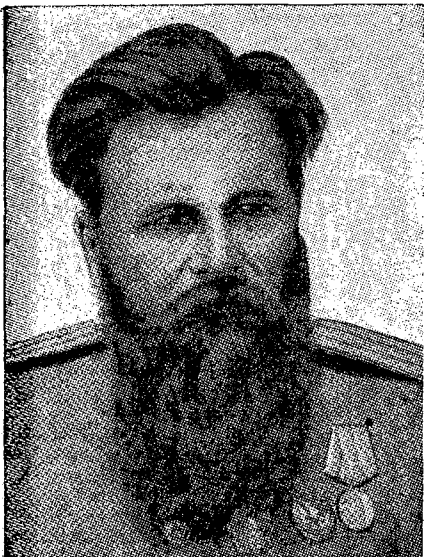
המחבר, גנרל-מיוז פטרו ורשיגורה

ראוי לציין במיוחד את פעולות הסיור ועבודת הסיירים, שאינה פוסקת לרגע, הן בזמן המסע, הן בזמן החנייה והן בזמן הקרבות. שתיים הן מטרות הסיור: (א) הספקת ידיעות על האויב ל"אדמה הגדולה" (הוא אומר, סיור "איסטרטגי"); (ב) השגת אינפורמציה על האויב, המשמשת יסוד לפעולת היחידה עצמה.