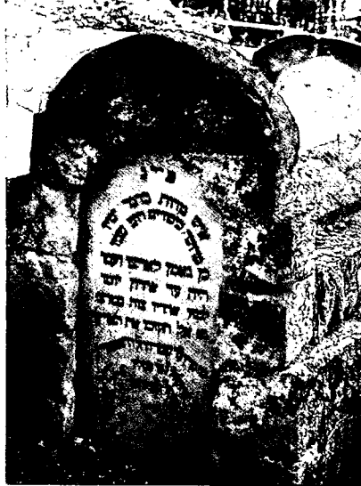
הירידה מהארץ — בעיה כואבת כבר בימי העליות הראשונות