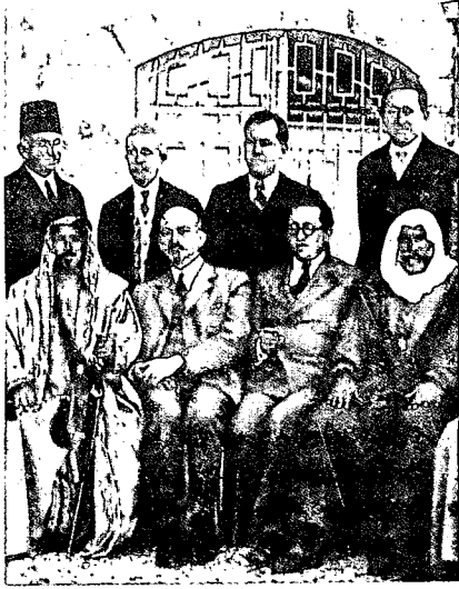
מנהיגים ציוניים ונכבדים ערביים ב־1931 – הציונות לא גרסה: "או אנחנו או הם"

עות וזיעה וכישלונות. אין בונים עם בדור אחד. כמה זמן לחמו ההולנדים, למשל, עד אשר זכו בחירות? הפולנים עדיין לוח־מים. כדי לגבור על המשבר והייאוש יש לראות את הדברים בראייה פאנורמית. הנה מאה השנים האחרונות 1881 – 1981. מאה שנים ל"סופות בנגב", לפוגרר מים בדרום רוסיה, ראשית הגירת מיליונים לאמריקה ואלפים לארץ ישראל. מאה שנים נוראות ונפלאות. ואתה מסתכל ורואה מה עלה לגלות, ומה קרה בארץ ישראל. כמה מדינת ישראל ושלושה ורבע מיליוני ישראלים בה, ונכסי חומר ורוח וריבונות ומגן – וכל זאת לאחר החורבן הגדול, כאשר רבים חששו כי לא יעמדו לו לעם כוחות התחייה לאחר המכה האיומה ההיא על אדמת אירופה.