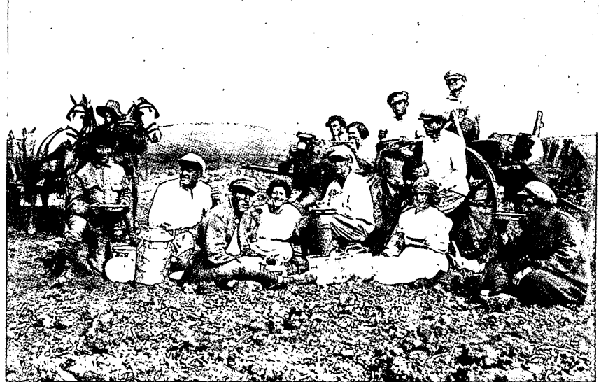
"גדוד העבודה" — מופת של עבודת כפיים ובניין הארץ

מבקשים בשורה, ואין זה פשוט, ומה שאתה יכול לומר הנו כך: להוריד העני-בות, להפשיל השרוולים, לעבוד קשה. לחזור ל"גדוד העבודה", לעבודת כפיים, לבנות ארץ, לבנות עם, לחנך. אבל כל זה תובע זמן.