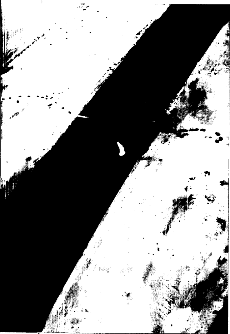
גשר מצרי על תעלת סואץ, שנהרס בהפצצה של חיל האוויר

הנחתת מכה מקדימה רק על שדות התעופה בסוריה אומנם הייתה חוסכת לחיל האוויר מקצת הלחימה על העליונות האווירית מייד עם פרוץ הקרבות, אולם היא לא הייתה משנה את המציאות שנוצרה בימים הראשונים לפרוץ מלחמת יום הכיפורים: הצורך לסייע לכוחות היבשה מול מטריית טילים פעילה של האויב. יתר על כן, מכה אווירית מקדימה בחזית הסורית בלבד לא הייתה משנה את המציאות בחזית המצרית, אלא אם היא הייתה יוצרת אפקט פסיכולוגי שהיה מרתיע הן אותם והן את הסורים מלצאת למלחמה. ראוי לציין כי בדיונים שהתקיימו בשעות שלפני פרוץ המלחמה כלל לא נידונה האפשרות למנוע את המלחמה באמצעות הנחתתה