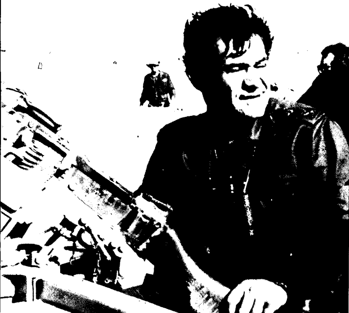
רא"ל דוד אלעזר: חיל האוויר תמיד נחשב אצלנו כמרכיב בעל חשיבות ראשונה בבלימה. כלומר, שהוא יצטרך לתת תרומה בשלב הבלימה

שיעור: המלחמה הישראלית-מצרית הידיעה בעל פה על כוונתה של מצרים לפתוח במלחמה עוד באותו יום הגיעה לרמטכ"ל סמוך ל-04:30, והפעולה הראשונה שהוא נקט הייתה להתקשר טלפונית למפקד חיל האוויר, אלוף בני פלד, בשעה 04:40. הרמטכ"ל מסר לאלוף פלד את הידיעה והודיע לו כי הוא רוצה לפתוח את המלחמה במכה אווירית מקדימה. 11 בהמשך השיחה דנו הרמטכ"ל ומפקד חיל האוויר על שיטת ההתקפה האפשרית. באחד הכנסים שנערכו לאחר המלחמה