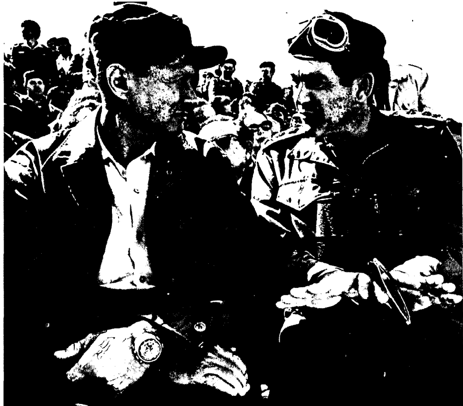
שר הביטחון משה דיין והרמטכ"ל דוד אלעזר. הרמטכ"ל הציג בפני שר הביטחון את שתי הבעיות העיקריות התובעות את הכרעת הדרג המדיני: המכה האווירית המקדימה והגיוס

אותו בידעיות, והם דנו בשאלות המכה המקדימה, היקף הגיוס, שיטת הגיוס וההכנות שיש לבצע בתחום ההגנה האזרחית בחזית ובעורף. סגן הרמטכ"ל הציג את הדילמה אם לנסות למנוע את המלחמה או לפעול מתוך הנחה שלא ניתן למונעה ולנקוט את כל הצעדים הדרושים לקראתה. הרמטכ"ל קבע שיש לפעול כאילו המלחמה ודאית, ומכאן נובע שיש לנקוט את הצעדים המיטביים לקראתה. לגבי המכה המקדימה ציין הרמטכ"ל, שאם תינתן הפקודה, ניתן יהיה להנחיתה בסביבות 14:00-15:00.