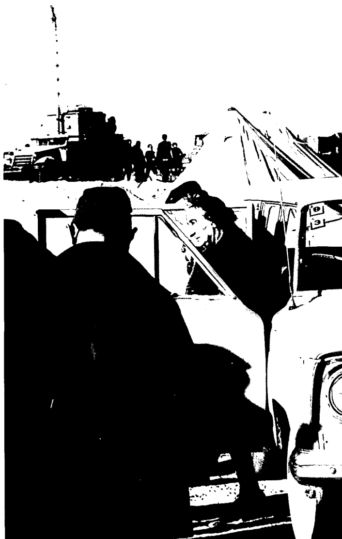
עֵתָה – הִיא קוֹנֵה – מִתְגַּלֶּה הָעוֹלָם בְּכָל נִבְזוּתוֹ

הכרח להחליט מיידית בעניין, שכן נותרו ארבע שעות (עד המועד להנחתת המכה המקדימה – 12:00) להידברות עם ארצות־הברית. ייתכן – אמר הרמטכ"ל – שבמרוצת זמן זה ישתכנעו האמריקנים בוודאותה של המתקפה הערבית, ואז יינתן אולי לישראל להנחית את המכה המקדימה. אם תנאים אלה לא יתמלאו, אמר, יהיה חיל האוויר מוכן לתקוף ב־זמנית עם תחילתה של מתקפת האויב. כדי להדגיש את חשיבותה של המתקפה המקדימה ציין הרמטכ"ל שמצרים וסוריה מתכוונות להתחיל את מתקפתם בתקיפת