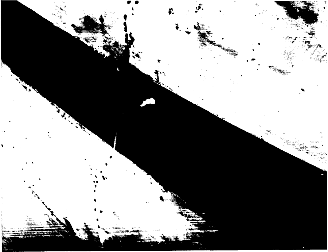
חיל האוויר מפציץ גשר מצרי על תעלת סואץ