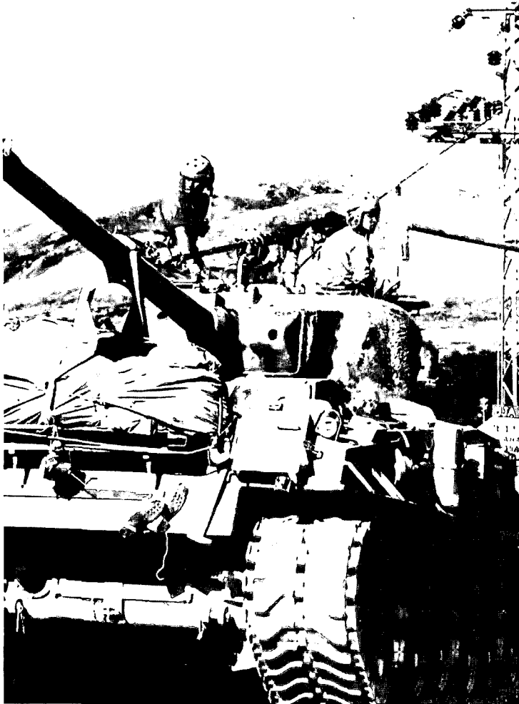
טנקי "אם-50" עולים לרמת הגולן. מלחמת ששת הימים היא התגלמות המודל הקנסי של תורת הביטחון שלנו

ומתקפה), על פני האפשרות של מגננה קצרה ביותר ומעבר מהיר למתקפת נגד. * מלחמת שחיקה במגננה. מאפשרות זו יש להיזהר כמו מאש.