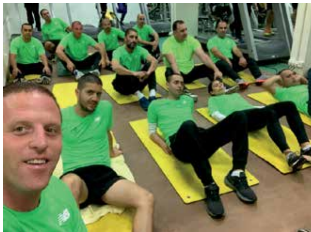
אימון גופני בקורס פו"ם נגדים מחזור שביעי, ינואר 2019

זאת מתוך תפיסה לפיה הנגד הוא שותף לפיקוד על היחידה. ברור אפוא כי הטמעת השינוי במעמדו של הנגד ובמערכת הדרישות ממנו מחייבים גם שינוי תפיסתי נרחב בקרב מערכים אחרים, בדגש על מערך הקצונה בצה"ל. נראה כי בדרג הקצונה הבכירה בצה"ל חלה התקדמות רבה לעומת דרג הקצונה המערכתית (סא"ל, רס"ן) העלול למצוא בנגד החדש איום על ריבונותו ביחידה. על כן, לצד הטמעת התמורות בתפיסת הנגד החדש בקרב הנגדים עצמם יש לפעול להטמעתן במקביל גם בקרב הקצונה, החל משלב הכשרת הקצין הבסיסית. ההערות למאמר הזה מתפרסמות בסוף הגיליון.