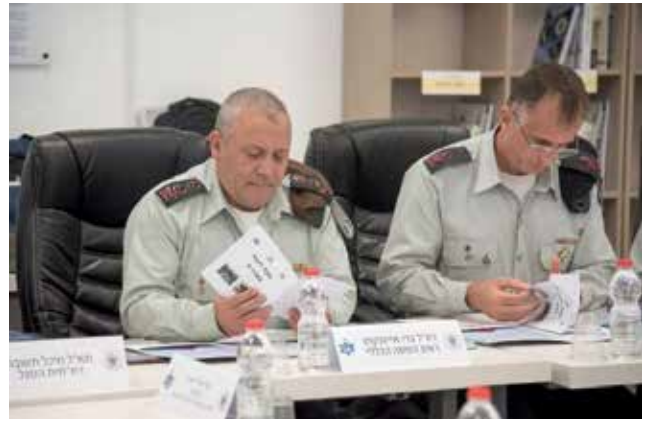
חניכת בית הספר לנגדים בראשות הרמטכ"ל גדי אייזנקוט, אוקטובר 2017

של הנגד, ופחות במתן כלים פיקודיים להתמודדות עם אתגרי הפיקוד. 2 ייעודו של בית הספר "להוות מרכז להכשרה בין-זרועית אחודה של הנגדים בצה"ל למקצוע הפיקוד הצבאי, לקדם את מערך הנגדים כמפקדים בעלי גאווה ותחושת שייכות לצה"ל ולמדינת ישראל". לאור ייעוד זה נקבעו המטרות וההישגים הנדרשים של הקורסים, ובשניהם יש עיסוק רב בציר הפיקוד והמנהיגות.