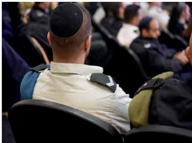
נגדים בכנס לציון שנת הפעילות הראשונה של בית הספר במהלכה הוכשרו למעלה מ-500 בוגרים

החל שימוש במושג "הנגד החדש". בבואנו לענות על השאלה מיהו הנגד החדש בצה"ל, ראשית יש לבחון את המושג "נגד חדש" בראייה ביקורתית, שכן עולה השאלה האם הטמעת המושג דורשת גם את קיומו של המושג "נגד ישן". נראה כי התשובה לשאלה זו שלילית, וכי המושג "נגד חדש" נועד לבטא תפיסת עולם חדשה באשר לתפקידו של הנגד ולדרישות המערכת ממנו. שימוש במינוח "נגד חדש" הוליד במקביל גם את הביטוי "נגד ישן", המבטא תפיסה שמרנית לפיה במהותו הנגד פועל מתוך זיקה למקצוע שהוסמך לו ובו פיתח מומחיות אותה רכש עם השנים, ללא התייחסות למרכיבי תפקיד נוספים החשובים להצלחתו של הנגד בתפקידו. בשולי הדברים מרמז המושג "נגד ישן" על היעדר תוכנית הכשרה בתחום הפיקוד, חרף ההתמודדות ההולכת וגדלה עם אתגרי הפיקוד, וכפועל יוצא חוסר כלים פיקודיים להתמודדות מורכבת זו.