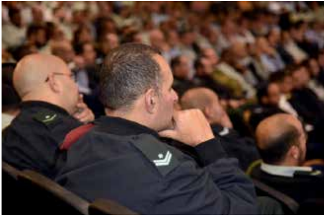
יום עיון לציון שנת הפעילות הראשונה של בית הספר לפיקוד לנגדים, פברואר 2019