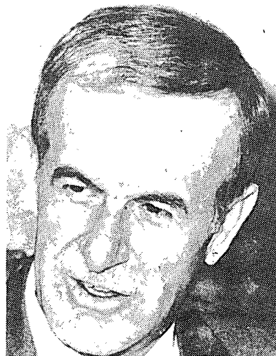
חאפז אסד – אדריכל רעיון האיזון האסטרטגי

בנושא המשבר הלבנוני ניכר למשל ניסיון סובייטי להניא את הסורים מלהחריף את הלחימה בנוצרים, ויתכן אף להזהירם כי במקרה של הסלמה בלתי רצויה והיסחפות