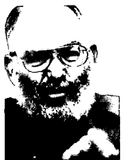
מפקד המכללה לביטחון לאומי

בלא ידיעת אלה ייכשל המפקד הצבאי – גם אם יצטיין בכך שהוא סוחף את אנשיו ונוסך בהם ביטחון. כפי שטענתי במאמרי הקודם, כדי לשפר את רמת ה"אמנות" ולעמוד בדרישות החלק ה"מדעי" צריך המפקד ללמוד את המקצוע הצבאי. תחת הכותרת הזאת כוונתי היא לכלל הידע הצבאי, העקרונות של המקצוע והדרך (השיטה)