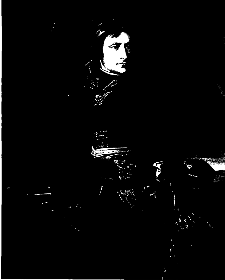
נפוליאון בונפרטה: "כל המצביאים הגדולים לא ביצעו מעשים גדולים אלא מתוך התאמה לכללים ולעקרונות הטבעיים של אמנות המלחמה"

נפוליאון הבין שהגאוניות הצבאית מתבטאת קודם כול בדיעה ובהבנה של הכללים ושל העקרונות האוניברסליים ולאחר מכן בהתאמתם באופן נכון למקרה המיוחד שבפניו ניצב המפקד. "תחבולה" ו"התאמת האמצעים למטרות" מוזכרות על ידו כגורמי המפתח.