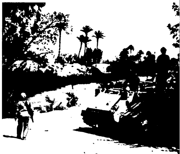
חפיק של צה"ל ממערב לתעלת סואץ

המתאימים לכל אחד מהמדרגים הללו – לכל מדרג במונחים, בשפה ובמושגים המתאימים לו (כשעקרון הפשטות נכון גם כאן: יש צורך במושג שונה רק אם הקיים אינו מתאים). הצורך של כל רמה לשרת את זאת שמעליה (כמו גם את זאת שמתחתיה), כאשר חלק מתפיסת הצורך והפתרון הרצוי שונים בהכרח, מביא לשיח בין האנשים ברמות השונות, להבהרת הצרכים והיכולות, המגבלות, הסיכונים והאילווצים – כל אחד מנקודת מבטו. כך נוצר תהליך קבוע של תיקונים ושל השפעה הדדית בין הרמות השונות (בשני הכיוונים), והדברים מובהרים ומובנים יותר לכלל המפקדים. בכל זאת נותרת שרשרת היררכית – במובן זה שההישג האסטרטגי חשוב מזה הטקטי, ולכן קובע יותר את המסגרת הכוללת ומכתיב באופן עקרוני את "כיוון" המעשה האופרטיבי והטקטי. (ועם זאת ברור שרצף של כישלונות טקטיים – בוודאי אופרטיביים – יכול להביא לכישלון אסטרטגי, ולכן על אף ההיררכיה יש במציאות תלות הדדית בין הרמות