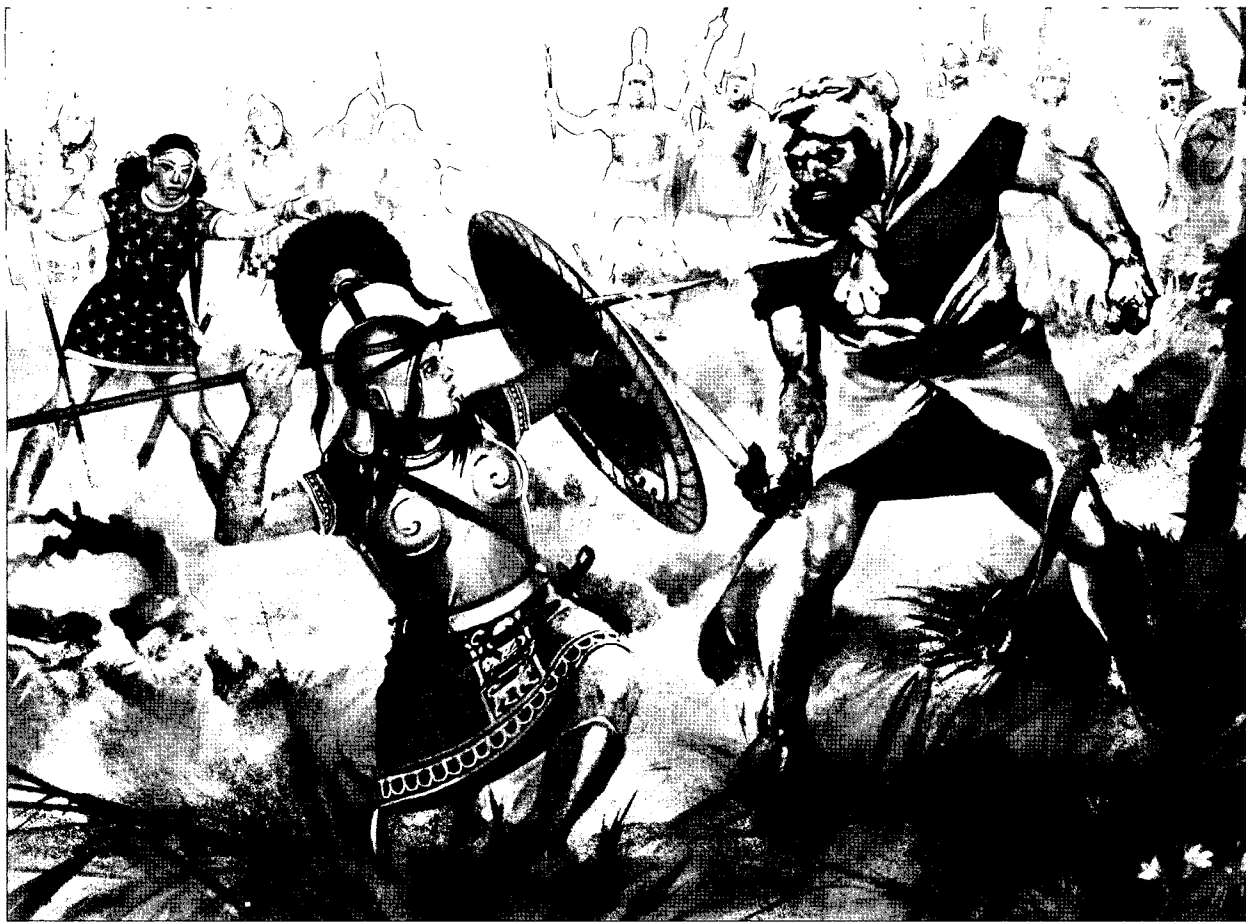
הקרבת המיתולוגי בין הרקולס למליניפה, מפקדת האמזונות

תכונות נשיות מול תכונות גבריות. רבות מהן אף הגיעו למסקנה שנשיות גבריות ייחודיות, כגון תחרותיות יתר, קרירות רגשית, תקשורת לקויה ותוקפנות, הן שאחראיות למרבית תחלואי העולם, לרבות המלחמה. 3