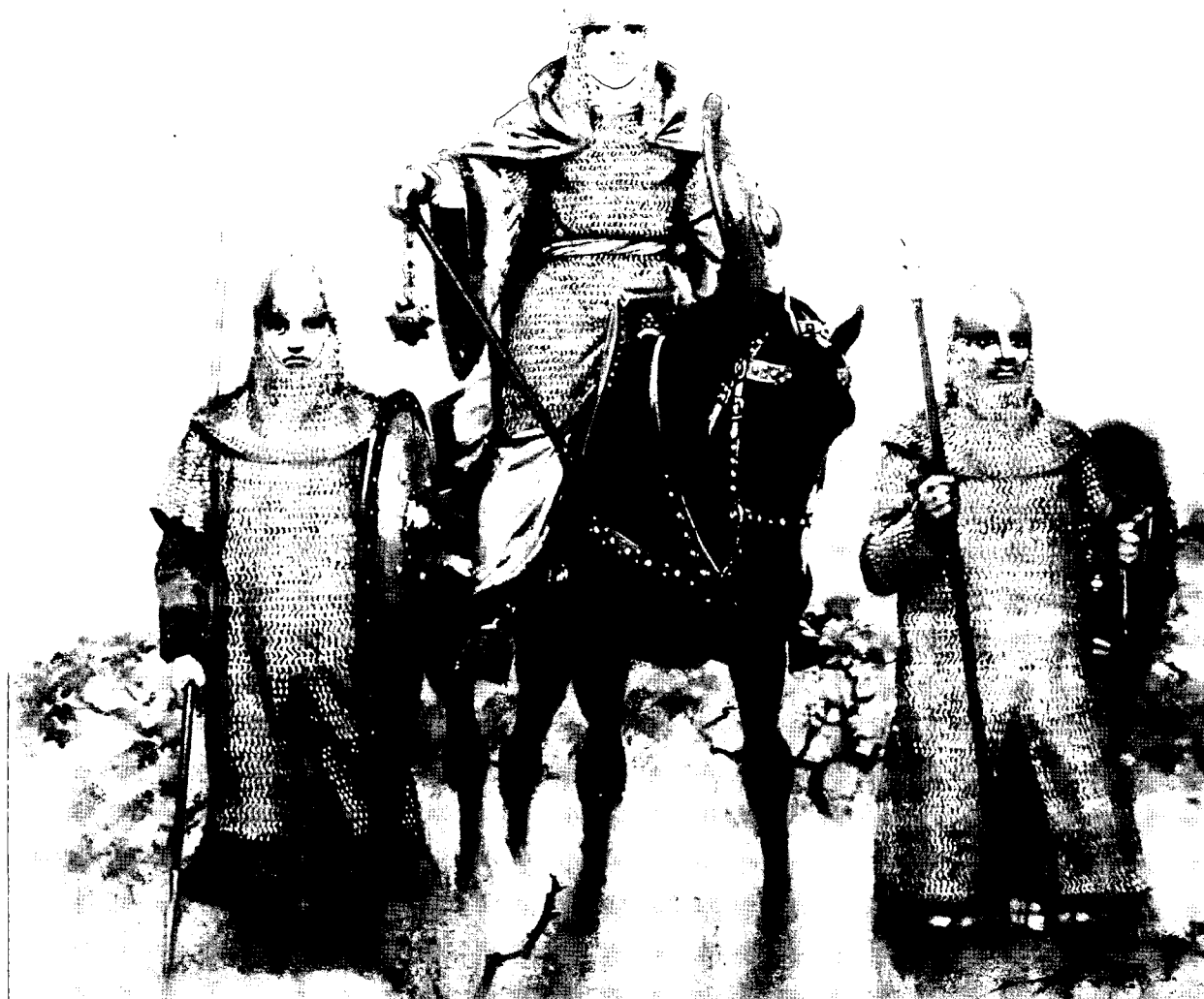
מטילדה, הרוזנת של טוסקנה, רוכבת כשהיא מלווה על-ידי לוחמים שלה. ציור של אנגוס מקבריייד

שחזקו אלה את אלה – הפכו את הגברים לבעלי נטייה חזקה הרבה יותר להילחם. מעניין לציין כי גם היום מגלים סקרים שנעשים במערב באופן עקבי תמיכה גברית גבוהה יותר מאשר התמיכה הנשית במדיניות שכוללת שימוש בכוח צבאי. 10