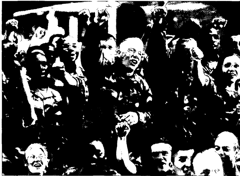
לוחמים ולוחמות בצבא ארה"ב

גם ההבדל המנטלי בין המינים ביחס לחימה הצטמצם, אך לא נסגר. מאחר שחלק ניכר מהלחימה היום נעשה מרחוק ובמגע פיזי מועט, הלחימה עצמה כרוכה בהרבה פחות תוקפנות ואלימות. הלחימה עדיין אינה "מלחמת כפתורים", אולם יותר מאשר אי פעם היא נושאת אופי של עיסוק הדורש מקצועיות קרת מזג ומשמעת ארגונית יותר מאשר נטייה תוקפנית. אין ספק שנשים רבות יוכלו, אם ירצו, להתמודד בהצלחה עם האתגר המנטלי של הלחימה. אך נשאלת השאלה: האם הן ירצו? הסימנים מראים שמספרן של אלה שירצו קטן בהרבה ממספר הגברים שירצו בכך. גם