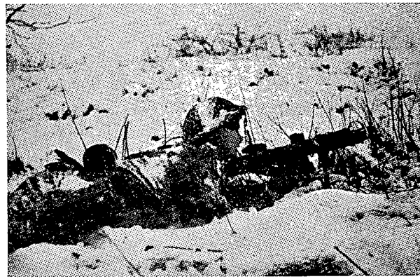
"צייד-טנקים", בחזית הארמיה השנייה, אורב לשריון הגרמני.

על-מנת להסתיר את החלפות הכוחות בקו-החזית, שבוצעו לקראת המתקפה, נהגו הגרמנים להשאיר במוצבים הקדמיים יחידות-משנה מהער-צבות שפוגו בינתיים לעורף; וכן העלימו, בכסות