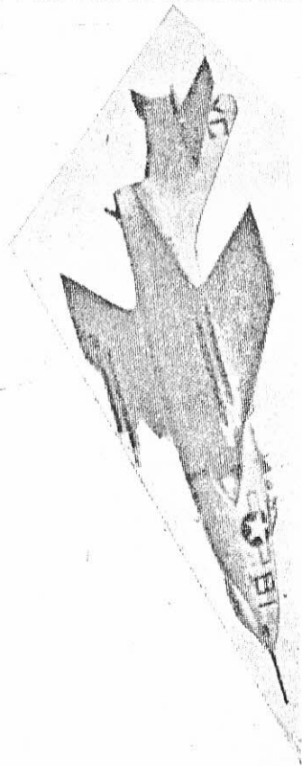
האפשר לקרב אותו עוד?