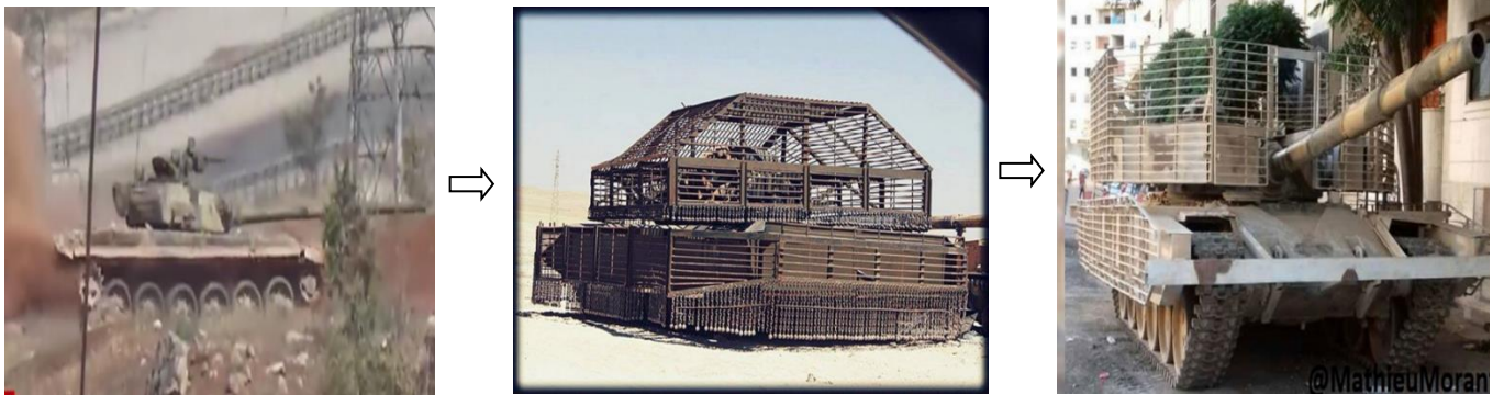
התפתחות מיגון הטנקים באוגדה 4 : משמאל טנק בעמדה בקרב, במרכז גרסה לא מבצעית, מימין טנק בסיום תהליך המיגון

תחילה נוסה מיגון סטטיסטי על התובה והצריח, וביניהם שרשראות פלדה (המכונות בצה"ל "שערות שולמית"). לאחר מכן הבינו הסורים שמיגון זה פוגע ביכולת הניידות של הטנק וכי לא ניתן לבצע צידוד יעיל, וכמובן שדה הראייה הוגבל על-ידי מעטפת הברזל מסביב לטנק. לבסוף הגיעו לדגם המחודש והממוגן יותר "T-72 עדרא", שבו שולב מיגון סטטיסטי על התובה ועל הצריח ללא חיבור ביניהם, כדי לאפשר צידוד והגבהה של התותח. גם שרשראות הפלדה הוסרו עקב חוסר יעילותן מול טילי נ"ט שהיו ברשות המורדים.