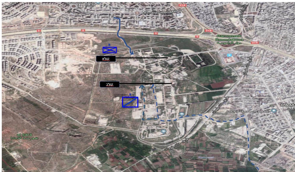
קרב ההכרעה, 3-5 בספטמבר 2016. לא נמצא תיעוד למהלכי המורדים

בערב 3 בספטמבר יצאו גדוד לואא אל־קדס עם פלוגה לעבר קו הבתים הראשון של המכללה. הפלוגה כבשה את שני המבנים הראשונים, ולאחר שהצטרפו אליה צמד טנקים, נערכה להגנה. במהלך כל הכניסה ללחימה לא נרשמה עדות להפעלת התנגדות לפלוגה כלל. למחרת בבוקר תקף גדוד הנמרים את המתחם, ברכבים פתוחים באמצעות מקלעים. הגדוד נכנס דרך השער הדרומי של הבסיס, והתקדם בהסתערות ממבנה למבנה. גם כאן לא נתקל הגדוד בהתנגדות מאורגנת ונראה כי המורדים ברחו בדרך לא ברורה. לאחר טיהור המבנים חבר גדוד הנמרים לגדוד לואא אל־קדס והשטח הוכרז ככבוש. לאחר ארבעה קרבות קשים הצליח המשטר לסגור את הכיתור על חלב כולה. מערכה זו הסתיימה בדצמבר 2016, כאשר המשטר השיג שליטה מלאה על העיר ועל סביבתה, בעוד שהמורדים נסוגו מהעיר והעבירו את ריכוז המאמץ שלהם לעבר אדליב – שם הם נמצאים עד היום. 30 בסיום הכיבוש הוצב בעיר גדוד משטרה צבאית רוסי לטובת שמירה על הסדר. ואולם עם סיום הכיבוש עלו אינספור בעיות שלא קיבלו התייחסות בעת הלחימה על העיר, ובראשן עשרות אלפי העקורים והמחסור בתשתיות חיים בסיסיות. 31 כיום, משקיע משטר אסד בשיקום העיר שהייתה "בירת הצפון", ונראה כי נעשה ניסיון להחזיר את העיר למסלולה הקודם. בפועל, המרחק ממעמדה טרם המלחמה עדיין רב.