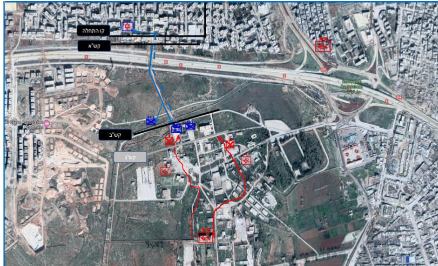
קרב התקפת הנגד השלישית, צהרי 19 באוגוסט. באפור - מהלך שלא הושלם