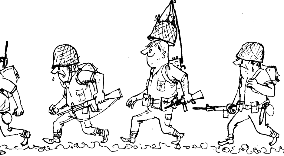
הקשרים „עושים חיים“

כדי לעמוד בכל זאת על פשר אותה קופסת מתכת, כדאי לציין, כי בזכותה עלה דוד על דרך המלך. וכי מי היה מעריך את קליעתו המוחצת של הנער אם היה גלית הענקי עומד לפניו בגילוי ראש מוחלט?