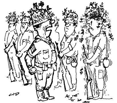
„פינקלשטיין, שוב ניסית לרמות אותי!“