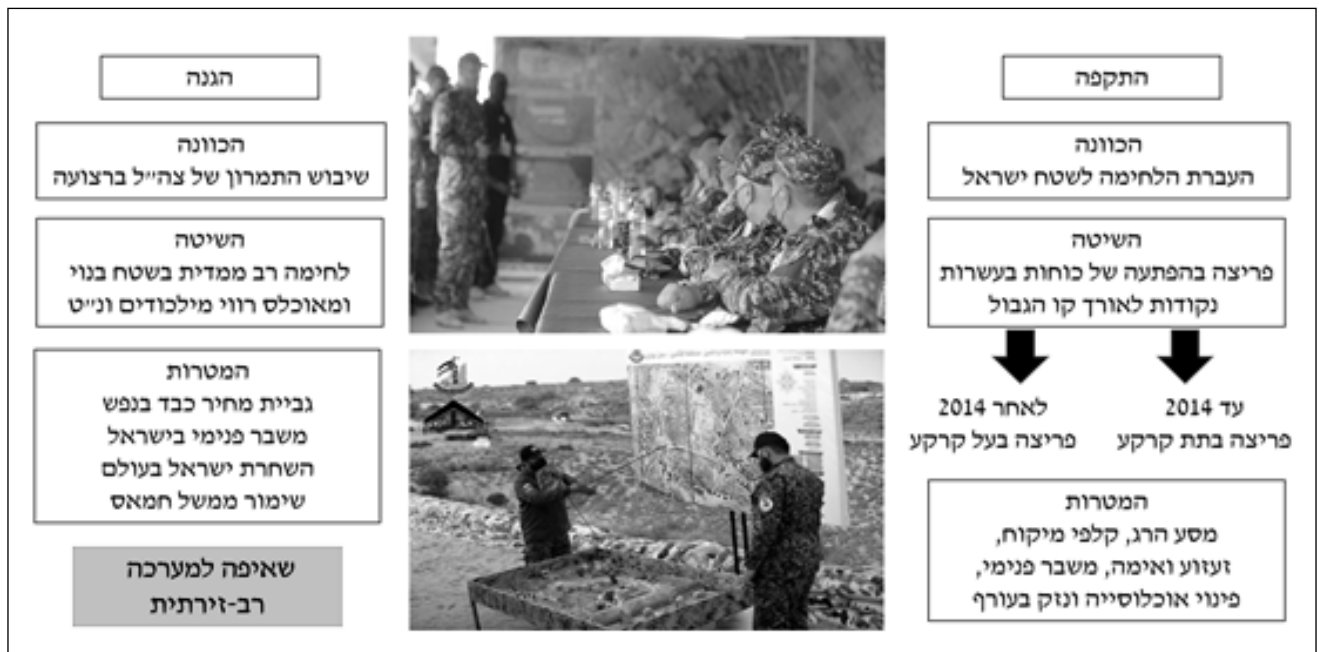
תרשים 3: תכנון אופרטיבי להגנה ולהתקפה

את חמאס מאוהב לאויב. תהליכים אלה געגו הן בתמיכה הכספית שהגיעה מאיראן, הן במערך ההברחות בגבול מצרים, שספג פגיעה מרכזית בשעתו, ודרדרו את תנאי המחיה ברצועת עזה. כפועל יוצא מכך נחתם הסכם שאטי, והוחלט על הקמת ממשלת ההסכמה הלאומית ועל היערכות לבחירות. 12 ואולם הבידול בין הגדה לרצועה נותר בעינו, בחירות לא התקיימו וחמאס התרעמה על חוסר נכונותה של הרש"פ לסייע בשיקום החיים ברצועת עזה לאחר ההרס הרב שנגרם ב"צוק איתן".