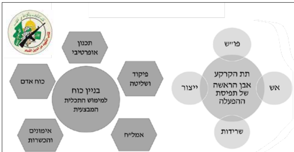
תרשים 2: גדודי עז אלדין אל-קסאם ברצועת עזה: תפיסת ההפעלה ואבני בניין הכוח