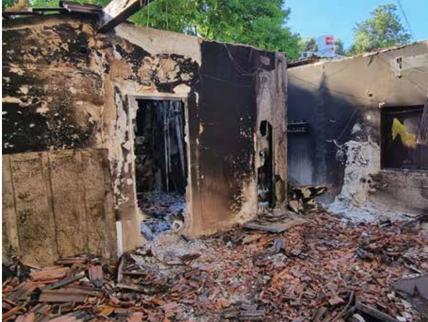
מבנה מגורים שרוף בקיבוץ בארי לאחר 7 באוקטובר. תרגילים רבים נערכו באופן שוטף, תוך שימוש במודלים שדימו את כוחות צה"ל ואת יישובי העוטף.