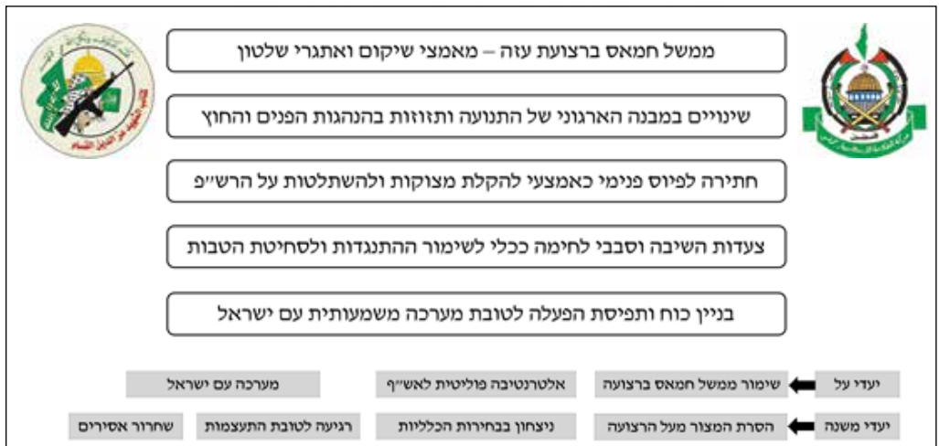
הרשים 1: מגמות מרכזיות בתנועת חמאס בשנים 2014-2023

אל מול יעדי העל ויעדי המשנה שלה. תנועת חמאס אשר השתלטה בכוח על רצועת עזה ביוני 2007 שמה לה למטרה לשמור על שלטונה, ומאז נקטה שיטות מגוונות לשבירת המצור שלתפיסתה השיתה עליה ישראל. הרצון של ממשל חמאס לספק את צורכי האוכלוסייה, בד בבד עם הברחה "סיטונאית" של חומרי גלם ואמל"ח, נתפסו כבעלי חשיבות לביצור שלטונה מבית וכתנאי הכרחי למימוש שני יעדי-על נוספים הנוגעים הן לזירה הפנים-פלסטינית הן למאבק המזוין בישראל. תנועת חמאס ראתה עצמה, בראייה ארוכת טווח, אלטרנטיבה לאש"ף. הצטרפותה לתהליך הפוליטי בשנים 2005-2006 והשתתפותה במערכות הבחירות המקומיות והכלליות, סימנו את תחילתו של תהליך השתלטות בגישה עקיפה אך לגיטימית, בעוד ב-7200 בחרה בעימות חזיתי וכוננה ממשל משלה ברצועה. במקביל, חמאס לא נטשה את החזון האידיאולוגי שלה ליזום מערכה עם ישראל שתזרוז את קיצה. לפיכך התנועה ברצועת עזה ניצלה את תקופות הרגיעה הביטחונית לבניין כוח ולהתעצמות, בעוד השלוחה שלה בגדה המערבית שימרה את הלחימה בישראל כביטוי לכך שדרך ההתנגדות מעולם לא נזנחה. בתקופה הנדונה חלה מעת לעת התנגשות בין היעדים השונים. לדוגמה: היוזמה לחמם את קו הגבול בשנים 2018-2019 פגעה ברגיעה אך נועדה להביא להתרופפות המצור על הרצועה, לסחוט הטבות כלכליות ולחזק את ממשל חמאס ברצועה. דוגמה נוספת היא העימות המהותי שיזמה חמאס במאי 2021, אשר הפר את הרגיעה ולכאורה פגע בהתעצמותה. ואולם בפועל, המהלך שימש כלי לניגוח הרש"פ (הרשות הפלסטינית), על רקע ההחלטה לבטל את הבחירות למועצה המחוקקת ולנשיאות, ושירת את מטרתה ארוכת הטווח לצבור עוד אהדה בחברה הפלסטינית לקראת