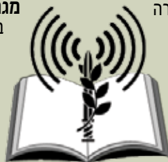
בית הספר הצבאי לתקשורת

במגמה הזאת מעניקים הכשרה בתחום התקשורת ובתחום של ממשקי צבא-תקשורת לכלל מפקדי צה"ל. המגמה בונה ומשלבת פרקי תקשורת במרבית קורסי הפיקוד והקורסים הבכירים בצה"ל, מתכנתת ומקיימת ימי עיון ביחידות השונות בזרועות, מתאמת הכשרות צבא-תקשורת בצה"ל ועוקבת אחרי מהלכן; מקיימת סדנאות בנושא של העברת המסר ועמידה מול מצלמה.