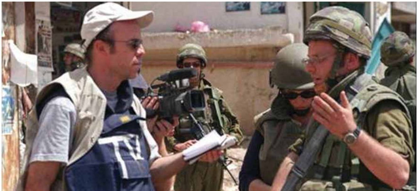
אנשי תקשורת במלחמת לבנון השנייה | המלחמה חידדה את ההכרה שמפקדי צה"ל זקוקים להכשרה מסודרת ושיטתית בתחום התקשורת

הוראת התקשורת בצה"ל קיימת זה שנים רבות. בהוראת אג"ס-תוה"ד מ'1997 - "ההסברה והתקשורת כרכיב בעבודת המפקד והמטה" - נקבע כי הקשר בין הצבא לתקשורת מחייב הכנה וידע מוקדמים הן בהבנת יחסי הגומלין וההיערכות בשטח והן במיומנות ההופעה בפני התקשורת. בהוראה הזאת נקבע כי בכל פקודה מבצעית יהיה כלול גם נספח תקשורת. ההתייחסות לנושא התקשורת הכילה שני ממדים: "האחד, ההיערכות בשטח