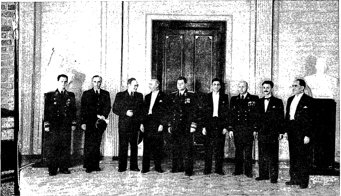
מגישה ראשונה של סגל נציגות ישראל עם אנשי משרד החוץ הסובייטי

בשיחותיו של אבא אבן (נציג ישראל באו"ם) עם מאליק (נציג סובייטי באו"ם) ונשיא מועצת הביטחון באותה תקופה) ב-5 באוגוסט, הביע מאליק את הערצתו העמוקה להישגים הצבאיים הישראליים: "הסובייטים סברו תמיד שהערבים חלשים מבחינה צבאית ולמסקנה זו הם הגיעו מראיית חולשתם החברתית". 14