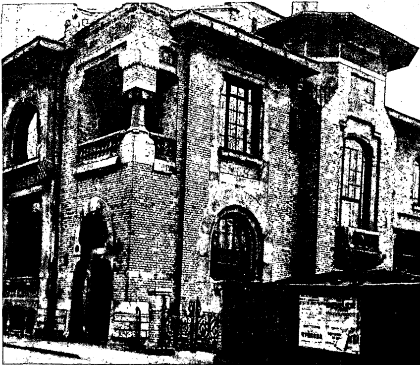
בית הנציגות הישראלית במוסקוה

הסובייטים לא התכוונו כנראה להרשיע סיוע צבאי ישיר מה גם שבתקופת הגשת הבקשה, העריכו כי ניצחון היהודים בא"י מובטח וההיענות לבקשה זו רק תזיק להם בשלב הבא במהלכיהם המדיניים במוזרחה. תשובה שלילית לא השיבו מטעמי נימוס ומשיקולים דיפלומטיים, עם זאת ראוי לציין שגם מדינת ישראל לא יצאה מגדרה ולא הופעל לחץ כלשהו מצדה בעניין זה. לעומת זאת, ניסיונות השגרירות הישראלית במוסקוה בעניין עליית יהודי ברה"מ נתקלו בשלילה מוחלטת. גם הנימוס הדיפלומטי נשכח כאשר הזהירו חד"משמיעית כי יש לחדול מניסיונות אלה. אף כי המגעים הישראליים-הסובייטיים בשאלת מתן סיוע צבאי לא העלו דבר, הרי אחדות ממדינות הגוש המזרחי הושיטו סיוע זה בצורות שונות, ובהנחיה סובייטית, כמצוין למעלה.