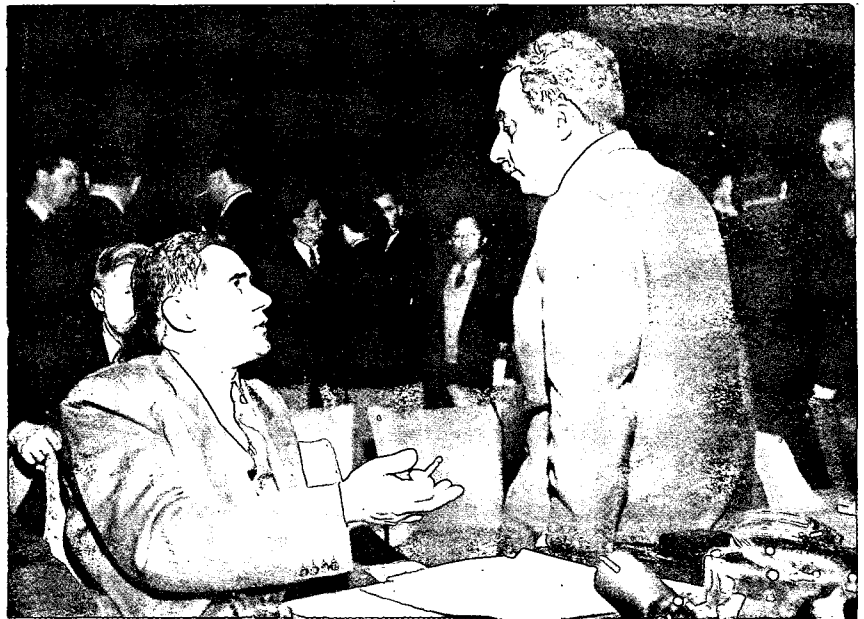
משה שרת עם אנדרי גרומיקו בעצרת האו"ם

פרשן פראבדה, יורי ז'וקוב, המתייחס להפרות ההפוגה במלחמה, נדרש למאמר בעניין זה בעיתון האמריקני ניו-יורק הראלד טריבון: "העיתון שולל כל נקיטת סאנקציות מטעם אר"ם נגד הפרות