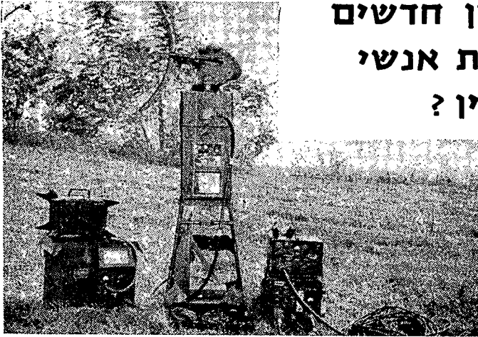
מטרת מכ"מ-21 AN/TPS בגדוד אמריקאי, המסוגלת לבצע את מכלול פעולות התצפית (מה שמכנים בשם „תשגחת“ — „surveillance“, בלע"ז).

רק קציני-המודיעין עצמם יכול, וחייב, לנתח ולהעריך אירוע זעיר זה — ולנסות לשבצו למ-קומו הנכון באותה חידת-פסיפס המהווה את הידוע לו על-אודות האויב. ואכן יהיה עליו לקבוע את הערכתו — ולפעול לפיה — ביחס לשורה ארוכה של שאלות לא-פשוטות; ואלו הן שאלות העשויות להכריע לגבי הערכת-המצב. עד כמה מהימן, למשל, מפעיל-המכ"מ שהיה בתפקיד אותה-השעה? מה משך-הזמן שבילה לפני כן על משמרתו, ליד המכשיר? הידוע על מקרים בעבר, בהם השתמש האויב בתחבולה זו (של תנועה בקרבתנו על-מנת לה-ביאנו לידי כך שנגלה לו ע"י אשנו את עמדת-תינו ואת כוונותינו)? הידוע על מקרים, בהם השתמש במעשי הונאה בכדי להטעות ולסכל את מפעילי-המכ"מ שלנו? בהשיבו על שא-לות אלו ורבות אחרות — שאלות אשר את-כולן יציג לעצמו לגבי כל גרגיר ופירור של קטעי-הידיעות שהועברו אליו ע"י כל מקורותיו השו-נים — יגיע קציני-המודיעין מדי-פעם לידי החלטה אשר תוסיף דבר-מה על ידיעתו את האויב. מהירות קביעותיו ודיוקן — הן המאפ-שרות לספק את המודיעין בנוגע לאויב הנדרש למפקד.