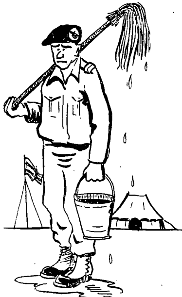
"תפקידי תורנות המחייבים אחריות ומנהיגות..."

ביצוע תפקידי תורנות במסגרת בסיס-ההדרכה, המחייבים בקורת, פיקוח, אח-ריות ומנהיגות — כגון מפקדי-משמר, סמל-תורן ואף קצינותורן בתחומים מצומצמים — לשם גילוי וטיפוח הגישה לחיילים, ההשליטה בהם;