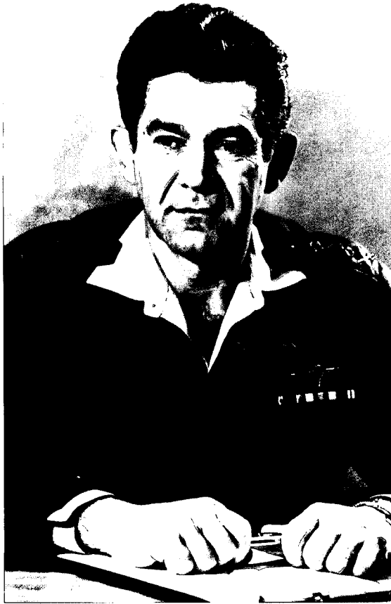
הרמטכ"ל (73) – רב-אלוף דוד אלעזר

"ישבתי כאן עד 9 בערב, וכל המטה הכללי היה במשרדיו עד 7 לערך. יכולנו לעשות הכול. אני הולך הביתה ב-9 וחושב לתומי, שכל אשר צריך היה להיעשות לפי תמונת המודיעין נעשה, ואיני יודע אותו זמן שלפני ארבע שעות בקומה מעליי הונח מידע על מלחמה..."