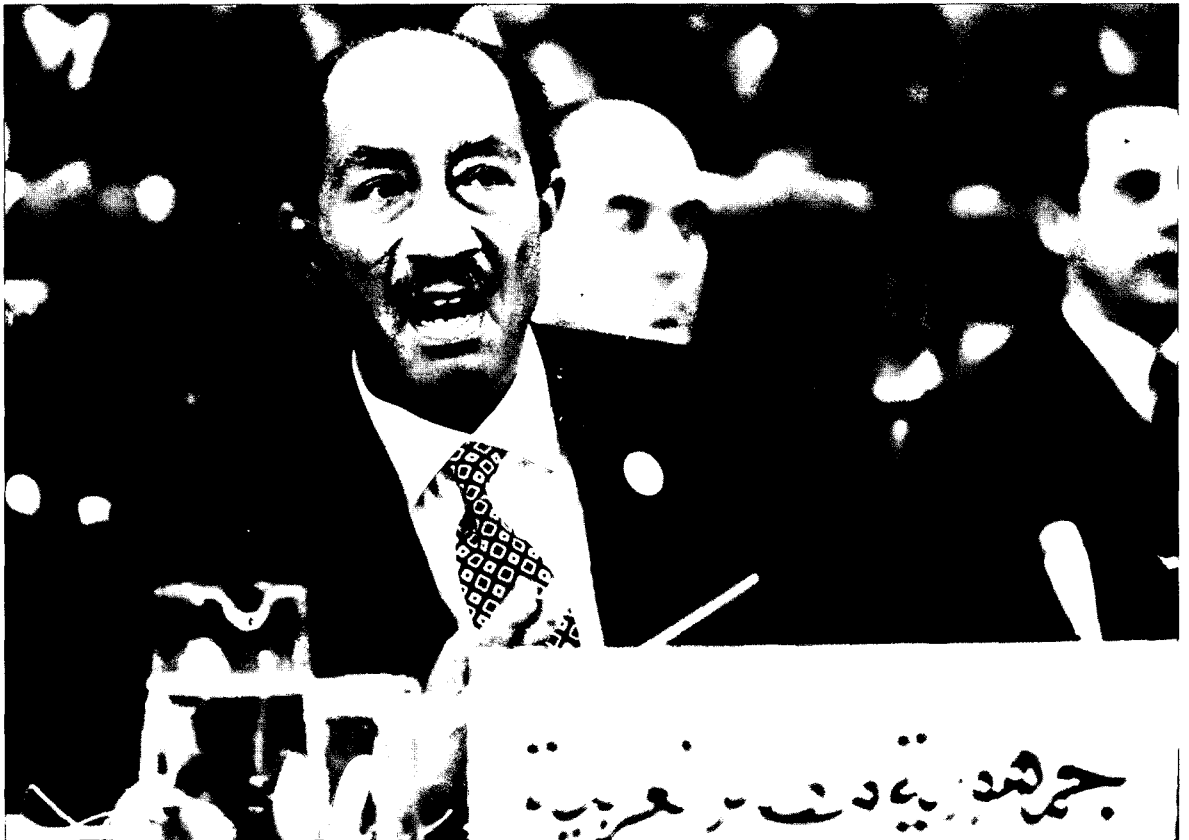
נשיא מצריים (1973) – אנואר א-סאדאת

כ-22 בספטמבר הודיע סאדאת לשר ההגנה ולרמטכ"ל שלו שהמלחמה תחל בתוך שבועיים