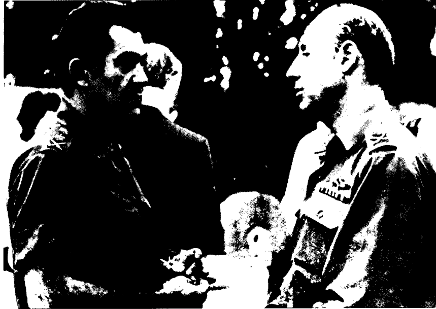
הרמטכ"ל וראש אמ"ן (173) – אלוף זעירא

לשילוב בין החלטת זעירא שלא להשתמש במקורות לבין הרושם שנוצר אצל הממונים עליו כי נעשה בהם שימוש היה אפקט קטלני על הערכותיהם של דיין ושל אלעזר באשר להסתברות שתפרוץ מלחמה