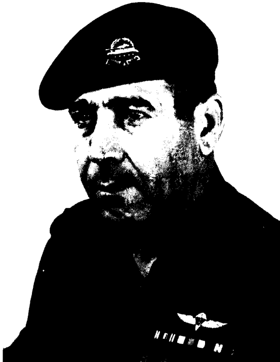
סגן הרמטכ"ל (73) – אלוף ישראל טל

אלוף ישראל טל ראה בקידום טנקי הגישור וסוללות הטק"א לעבר קו החזית אינדיקציה ברורה לכוננות ההתקפיות של הסורים, והוא אף יוזם דיון עם ראש אמ"ן בסוגיה זאת