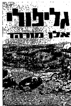
גליפולי אלן מורה

● ה"מורח-תיכוני". קושטא הסמוכה, בירת הקיסרות (שארץ ישראל נכללה בגבולותיה) — קן התככים ומזימות בין-לאומיות, טרף לשמועות ויעד להתקפותיהן, ה"שגעוניות" בהעזתן, של צוללות בריטיות; ה"תורכים הצעירים"; המיעוט הארמני המושמד וה"מגורש למקום שאיננו" — נוסח 1915, שריחו ריח 1943. ואם ישאל השואל: כיצד ייכלל כל זה בספר אחד ללא גיבוב, בבהירות ובתאום וללא הכבדה? תהיה התשובה: קרא — ותיווכח!