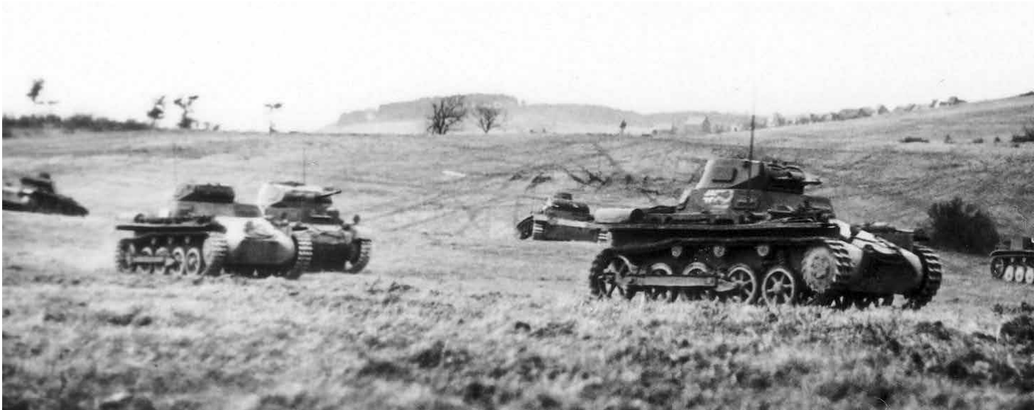
כוחות משוריינים של הוורמכט במהלך מלחמת העולם השנייה, יוני 1942. רובה המכריע של קצונת הלופטוואפה שירתה בקיר (זרוע היבשה) קודם להצבתה בחיל האוויר

בהלכה ובמעשה של הצבא הגרמני בשנות ה־20 וה־30. זאת כאשר באופן מובהק, ההלכה הפכה למעשה במערכות לכיבוש פולין, מערב אירופה ובחודשים הראשונים במערכה נגד ברית־המועצות. כך נוכל לטעון כי הבסיס לתכנון מערכות אלה, והאפשרות להוציא אל הפועל, נעוץ בפיתוח דוקטרינות שדרשו חשיבה מערכתית ומבצעים משולבים.