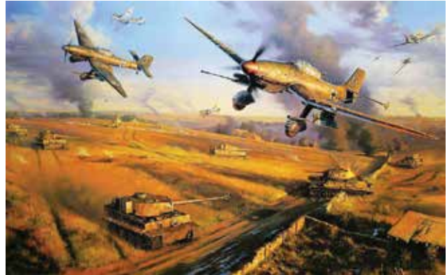
מטוסי הלופטוואפה במלחמת העולם השנייה. חיל האוויר היה אמור לשמש ארטילריה מעופפת על־מנת לסייע באש לכוחות המתמרנים

בתקופה שלפני המלחמה היה תהליך בעל היוון חוזר. הפיקוד העליון דרש מבצעים משולבים, כאשר דרישה זו הצריכה פיתוחה של תיאוריה מתאימה. התיאוריה שפותחה נוסתה באימונים ובתמרונים כשבצעקותיהם הופקו לקחים הנדרשים, והיכולת המשולבת הוטמעה שוב בתמרונים. 46 במהלך ההתערבות בספרד והמערכה בפולין היו מקרים רבים בהם הפציצו מטוסי הלופטוואפה יחידות של הצבא. הלקחים נלמדו היטב, והיכולת המשולבת המשיכה להשתכלל במסגרת תמרונים משותפים. זאת בעוד שהלופטוואפה מחייבת את עצמה באופן מלא למבצעים משולבים, ולתכנון מבצעי ההתקפה לעבר המערב. 47 מלבד מערכת האימונים וכתבת דוקטרינות, ניתן לזהות גם שינוי ארגוני חשוב המעיד על הרצון לשפר את תפיסת השילוביות. ב־1938 הוקמה ה־OKW (Oberkommando der Wehrmacht) – המפקדה העליונה של הכוחות המזוינים, ונוצרה מפקדת־על בפיקודו הישיר של אדולף היטלר שתאם בין שלוש הזרועות: יבשה, אוויר וים. 48 ראוי לציין כי כיום קיימת אסכולה בחשיבה הצבאית האמריקנית הטוענת כי על־מנת להשיג שילוביות מלאה ויעילות קרבית סינרגטית יש לאחד את כל זרועות הכוחות המזוינים האמריקניים לזרוע צבאית אחת. לפיכך ניתן לראות ב־OKW את תמציתה ואת ראשיתה של החשיבה המשולבת בגרמניה.