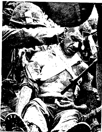
לויט"קול' ג. אייססור מיד לאחר היפצו בו אופן אנוש