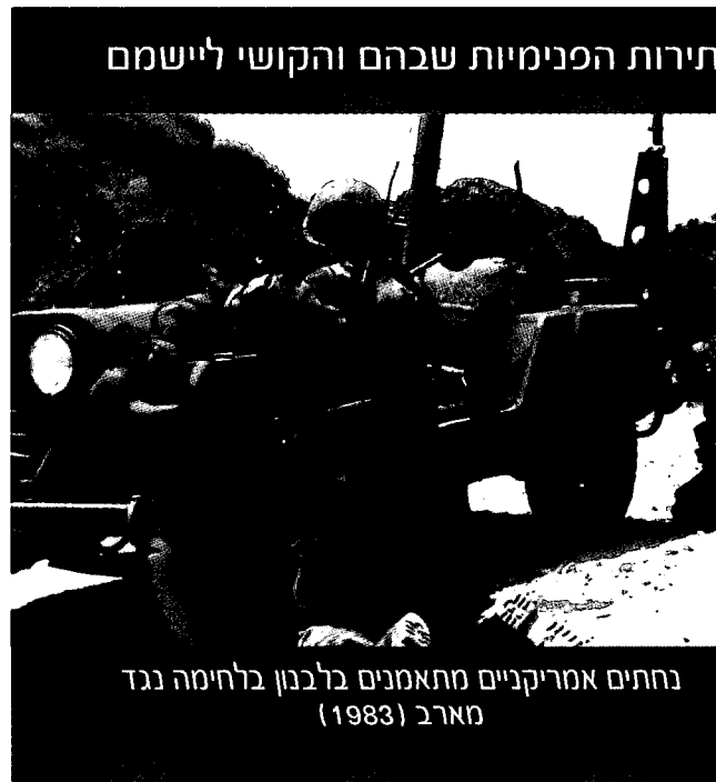
נחתים אמריקניים מתאמנים בלבון בלחימה נגד מארב (1983)

העידן הנוכחי מספק למתכננים ולמפקדים מידע רב שלא היה זמין בעבר, ולפיכך הם יכולים לעצב את המערכות באופן שיעשה אותן יותר אפקטיביות. המודיעין המשופר על היריב, השליטה הטובה על כוחותינו והחמ"ם יאפשרו לנקוט פתרונות