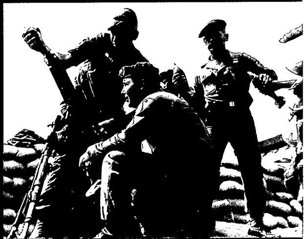
צוות כוחות מיוחדים של צבא ארה"ב יורה ממרגמה 81 מ"מ במלחמת וייטנאם (1966)

להתעלמות ממנו. המלחמה היא נגד אנשים ולא נגד מערכות נשק, ולכן יש לשים את התגובה האנושית במרכז השיקולים ולא את האפקטיביות של מערכות הנשק. הוא כותב: