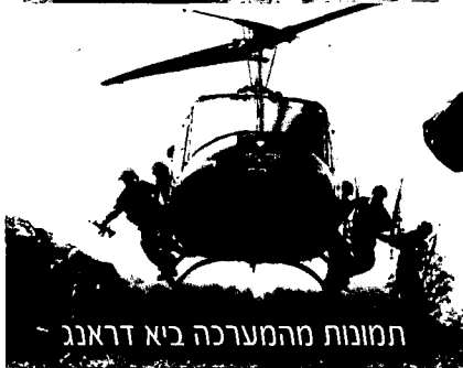
תמונות מהמערכה ביא דראנג

(Huey) הותקנו מקלעים, מטולי רימונים ורקטות, והם הופעלו במשימות של סיוע אווירי קרוב. יעילותם הייתה רבה אף מזו של מטוסי הקרב, כיוון שנמצאו קרוב לשטח והיו יכולים להימנע מלפגוע בכוחות ידידותיים. הסבתו של ה"וואי" ממסוק סער להובלת כוחות למסוק חמוש (Gunship) מסמלת את תחילת השימוש במסוקי קרב. ב-1967 נכנס לשירות מבצעי מסוק ה"קובר" (AH-1), הנמצא בשימוש מבצעי עד היום. 33 השימוש במסוקים הביא לידי ביטוי מעשי את עוצמת האש האדירה של ארצות-הברית בשדה הקרב. למערכות השונות בכל מהלך המלחמה - ובמיוחד בהתנגשויות הגדולות - הנחיתו המסוקים כוחות רעננים, קידמו סוללות ארטילריה למתן סיוע אש טוב יותר, 34 שימשו כמטווחים לארטילריה הכבדה, ולעיתים קרובות היו אלה המסוקים שסיפקו כוח אש מסייע ליחידות שעל הקרקע. אין כמובן לשכוח שהמסוקים הביאו לפינוי מהיר של פצועים משדה הקרב - דבר שהביא לירידה דרסטית בשיעורי התמותה מפציעות בקרב הכוחות האמריקניים.