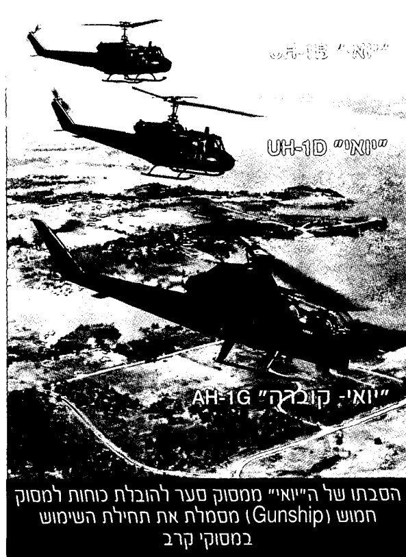
הסבתו של ה"יואי" ממסוק סער להובלת כוחות למסוק המוש (Gunship) מסמלת את תחילת השימוש במסוקי קרב

במהלך הקרבות בעמק יא דראנג שימשו המסוקים גם כארטילריה מעופפת. על מסוקים מדגם "יואי" - UH-1