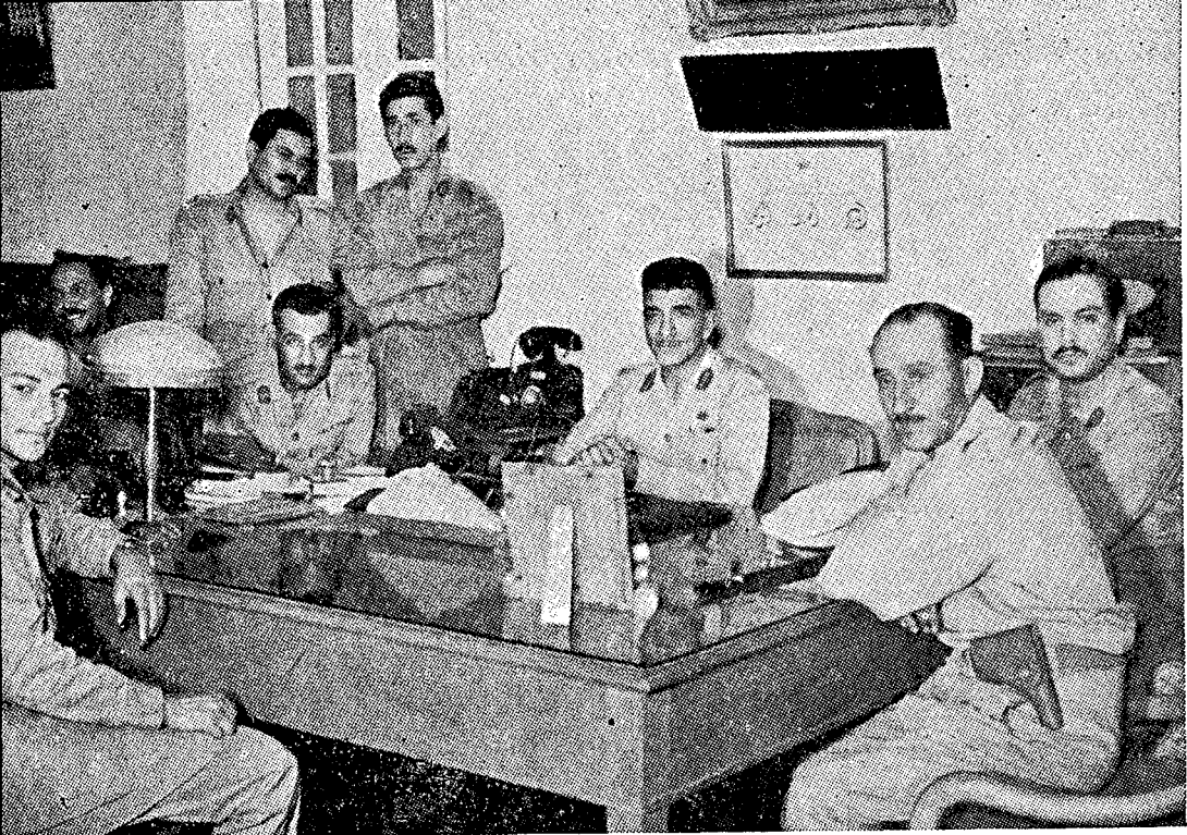
אחת הישיבות הראשונות של "מועצת המהפכה": נאג'יב במרכז, עאמר לימינו ועבד-אנ-נאצר רכון אל השולחן.

החינוך. במשך כל ימי המלחמה תמך בבריטים, אך ב-13 בנובמבר 1918, בתוך המלחמה, התייצב בפני הנציב-העליון הבריטי — ודרש עצמאות למצרים (אשר לאחר פרוץ מלחמת בריטניה תורכיה, הוכרז עליה, ב-1915, כעל ארץ-חסות בריטית מפורשת). כוחה של משלחת זו היה בכך שהיא ביטאה את רצון העם לכל שדרותיו — ואכן תפסה אותה משלחת מקום בולט בהיסטוריה של מצרים. ה"ופד" הפך מושג כמעט-מיסטי בציבוריות המצרית, ונקבע כשם לאותה מפלגה שנשאה בעיקר המאבק לזכויות המדיניות של מצרים במשך למעלה מ-30 שנה.