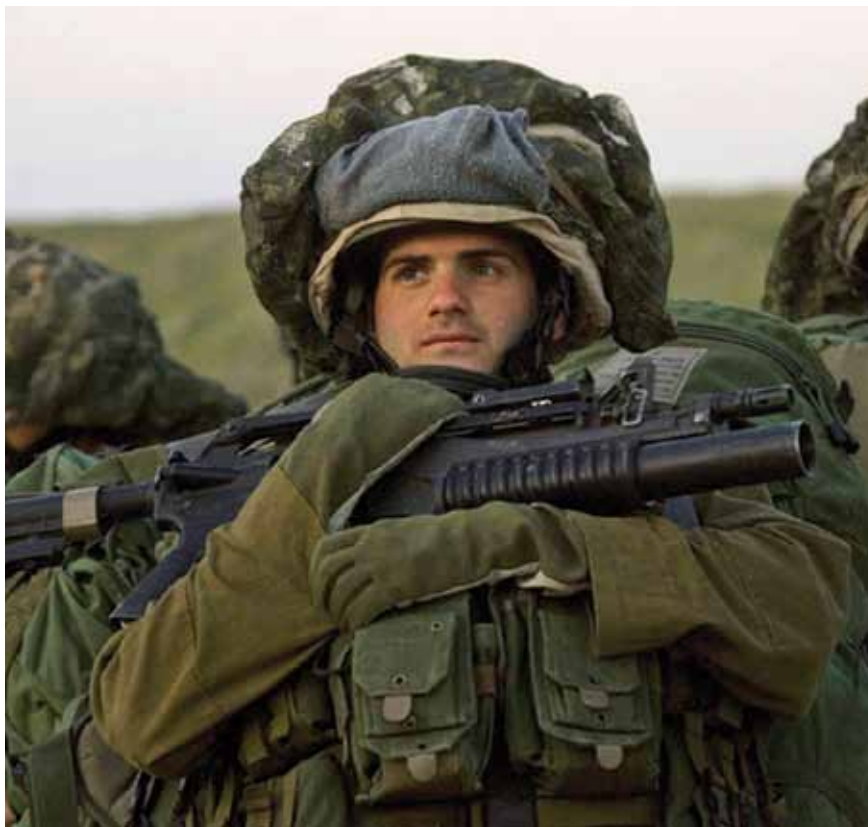
חייל מילואים | בשל העובדה ששירות המילואים הפך לסוג של התנדבות, וגיל הפטור ירד ל-40, רוב הסד"כ של יחידות ההכרעה בצה"ל הוא צעיר, וגילו הממוצע הוא 32

תהיה קלה יותר מהבחינה הזאת ומלווה בפחות דילמות.