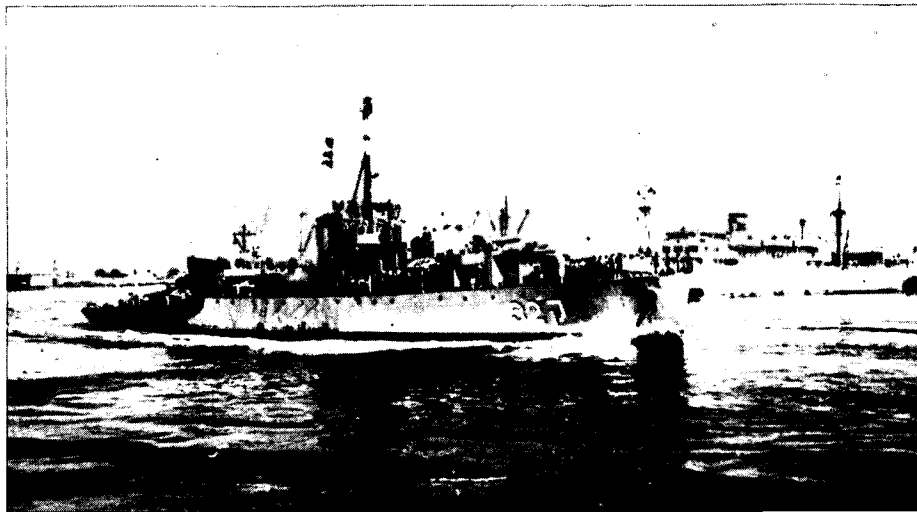
שתי משחתות שהיו בשימוש חיל-הים בשנות החמישים: ק-32 ו-ק-42

פעיל במלחמת העצמאות, סייע בטיהור אזורי החוף, והטיל הסגר על ערי רצועת עזה, פעל במסגרת המבצעים "יואב" ו"חורב", והגן על אניות שהובילו נשק ותחמושת לישראל. גולת הכותרת במבצעי החיל במלחמת העצמאות הייתה הטבעת אניית הדגל המצרית "אל-אמיר פארוק" על-ידי אנשי הקומנדרו הימי ופגיעה בשולת המוקשים "אמירה פאיוה" בחוף עזה. שליטתו של חיל הים בזירה הימית על אף עדיפות כמותית ניכרת של האויב, הושגה תוך מאבק מתמיד בציוד מיושן ובלתי מספיק, תוך חוסר ידע מקצועי וניסיון, ובהעזה ותושייה בקרב. לאחר מלחמת העצמאות החל שלב ההתארגנות וההתעצמות של החיל, שבא לידי ביטוי בפירוק ה"שירות הימי" ובהפיכתו לחיל הים