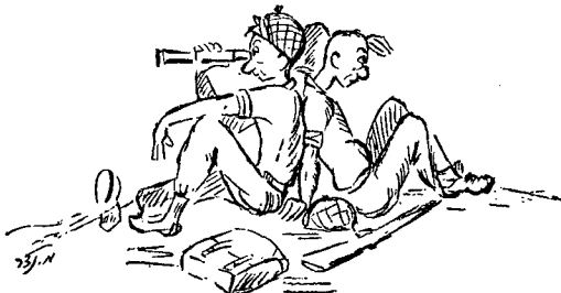
תצפית הקפית — גם כשהיחידה עיפה ביותר

התחפרות. קיים רק טיפוס אחד של שוחת-נשק שממנה נלחמים. ודא כי אנשיך יחפרו את שוחת-הנשק הנכונה, ושיוכלו להשתמש, בפעלם מתוכה, בכל כלי-הנשק בדיקנות ולפי התכונות המיוחדות לכל אחד מהם. את האדמה החולית שנחפרה מתוך השוחה יש לשאת למקום נסתר, או להשתמש בה