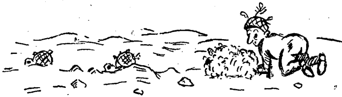
שימוש רע במחסה ע"י איש אחד...

רגלים, מימיות ומשמעת־מים, כלי אוכל ובישול — ואפשר עוד להרחיב ולהרחיב. נחזור־נא אל השטח המבצעי. נושאים כגון צעדה בשדה־הקרב, המנעות מתנועה בשבילים ובכבישים — מן־הראוי שיוקד עליהם גם בשעת רגיעה. בשדה־הקרב נמנע מלהצטופף; מן הראוי, איפוא, שנשמור על קיום רוחים גם בשעת רגיעה. בשדה־הקרב נתפוש עמדה במהירות הבזק; אל־נא נתרשל בזאת, איפוא, בשעת האימון. בשדה־הקרב יש לכל מבצע סכום, שלפיו מכונים את אימון היחידה. נעשה זאת בשעת האימון. בשדה־הקרב נחפש תמיד מחסה ומסתור; למה, איפוא, נעמוד בשעת האימון על כל גבעה גבוהה ותחת כל עץ רענן? בשדה־