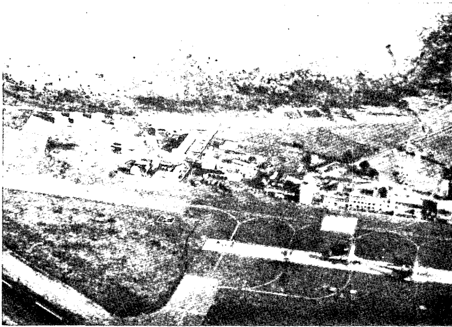
שדה התעופה באנטבה ובית הנתיבות שבו שוכנו בני הערובה. זהו אחד התצלומים ששימשו את צה"ל בעת תכנון הפעולה.

גם במבצעים מוטסים של צה"ל, בעיקר במלחמת ההתשה, היו הכנות יסודיות וממושכות, שכללו תכנונים משותפים, הצגות מפורטות ותרגילים. במבצע "רגיעה", שבהם נדרשת סבירות גבוהה להצלחה, אין משאירים דבר ליד המקרה וכל פרט מחייב ליכון, ניסוי ותרגול — על אחת כמה וכמה כאשר הטייסים נדרשים לבצע ביצועים גבוליים, כפי שאפרט בהמשך. פרק הזמן שחלף מחטיפת המטוס בסוף יוני ועד מבצע אנטבה, היה של שבוע ימים, אך מעשית, החל "שעון החול" לזרום כ-48 שעות לפני הביצוע. אין תקדים לנוהל קרב כה חפוז במבצע כה מורכב. הסיכונים האמיתיים נבעו מסיכום פרטים ומקבלת החלטות בלחץ זמן, מבלי שניתן לבחון ביסודיות את כל מרכיבי המבצע. נוהל הקרב לא נחקר באופן יסודי, ולכן אציג אותו בהמשך בעיקר מזווית הראייה של צוות המתכננים בחיל האוויר.