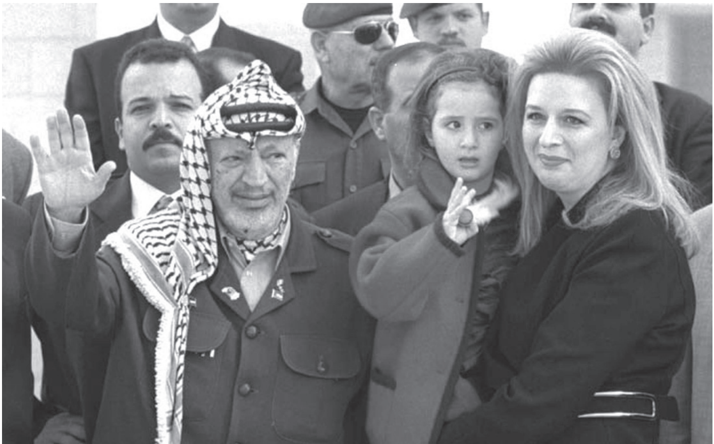
יאסר ערפאת | ערפאת בחר לצאת למאבק אלים רחב היקף נגד ישראל - מאבק שלא רק החיט אסון על עמו, אלא גם הביא להתמוטטות הרשות הפלסטינית, לבידודו שלו ולמעשה לירידתו מבמת ההיסטוריה

חשובים יותר. מהמקרים שהוצגו לעיל אנו למדים שגם במדינות טוטליטריות במזרח התיכון, שבהן השלטון לכאורה הוא חזות הכול, קיימת אפשרות שיתקבלו החלטות שהן בבחינת התאבדות. את האפשרות הזאת צריך תמיד להביא בחשבון, ואין לצאת מתוך הנחה שכל הגורמים ינהגו תמיד בהתאם להיגיון שלנו.