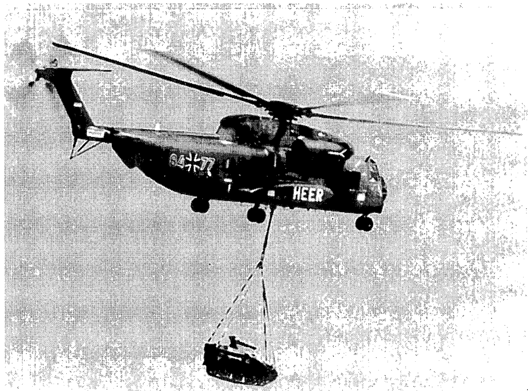
רק"מ נישא על ידי מסוק CH-53