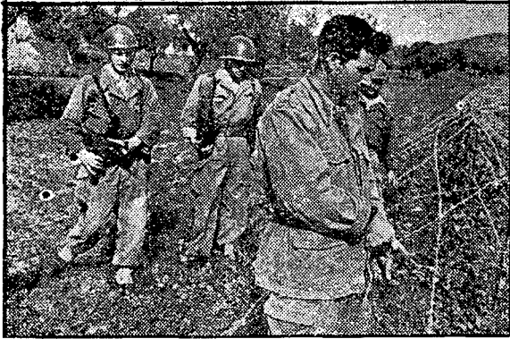
מורד־שבוי מדגים כיצד פרצו המורדים את הגדר המחושמלת הצרפתית, בעזרת מספרי־תיל שידידותיהן מצופות גומי.

בגלל הסתעפותם הרבה של שרותים אלה, והיקף התומכים בהם, אשר בלעדיהם לא יכולים היו להתקיים. עם זאת הרי פעילות זו, שהנה על־פני־רוב פרי־מעשיו של מיעוט מאוד־פעיל — דומה כי כלל־האוכלוסיה נשאר אדיש למדי ואף מסתייג, לגביה, ודי לעתים במצב נרחב של גייסותינו בשביל לחסל את עיקרם של שירותים אלה. נראה, איפוא, שקל־יחסית יהיה לבלום פעילות זו — ובעקיפין לחסלה, ואולי אף למנוע מראש בעד הופעתה — ע"י שנתקוף במחושב את אחד הגורמים העיקריים להתהוותה. כונתי — לסוכן־הגובה, שהנו אבן־ראש־פינה בכל בנין המרד, ושהוטל עליו מטעם האספה של ה"דואר" (אזור־משנה שבטי), או מטעם הקומיסר־הפוליטי (ולממניו אלה מוסר הוא את תוצאות "סיבובי־הגביה שלו) לגבות מכלל־האוכלוסיה את הסכומים בהם הושם כל אחד ואחד, לפי מפתח המתאים לאפ־שרויותיו.