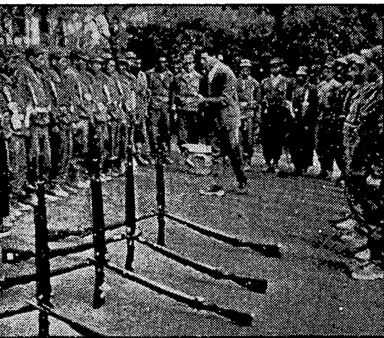
אימוני המורדים בגבול התוניסי: בהפסקה שומעת היחידה המתאמנת הסברה מפי קצין-הסברה.

בציר הראשון, הצפוני, נוטשות שיירות-הנשק את סוק-אל-ארבע, שהיא מצבור חשוב בצפון-תוניסיה, פונות אל גארדימאו — שם המופיע תכופות בהו-דעות-הרשמיות — ומגיעות אל סוק-אחרס, דרך ה-הרים המבוטרים והיעריים של אוור מדג'רדה, אשר כה קשה לפקח עליהם.