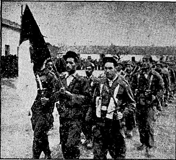
אימונים בגבול התוניסי: יחידת-המורדים יוצאת לאימונים כשבראשה נישא הדגל הלאומי.

הנסיון המבוצע, מזה למעלה משנה, באי-אלה אי-