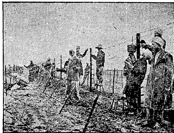
שלושה חודשים נמשכה הקמת הגדר לאורך 320 ק"מ של גבול אלג'יריה-תוניס.

(*) "ירוט" — Interception — מושג החל לא רק על מטוסים, כפי שמשמשים במינוח זה הילות האויר, אל אף על שליחים, פטרולים, שיירות וכדומה. — המערה.