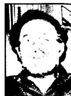
« פרופ' זאב מעוז « בית הספר לממשל ולמדיניות, אוניברסיטת תל-אביב